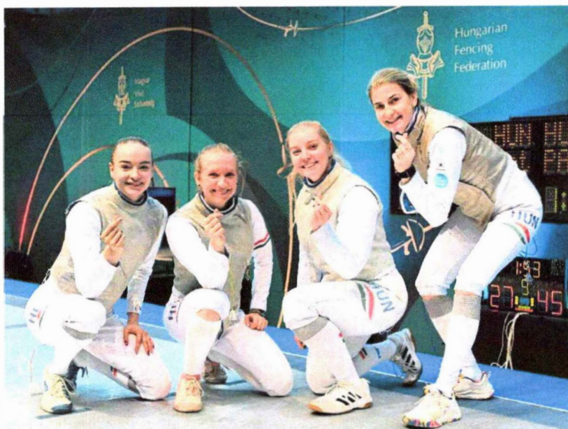
Csapat Magyar Bajnoki, Felnőtt Országos Bajnokság, Budapest, 2025.

Felnőtt női tőr csapatunk magabiztosan védte meg Országos Bajnoki címét 2025-ben is, miután meggyőző fölényrel verték meg a nagy rivális Budapesti Honvéd SE csapatát.