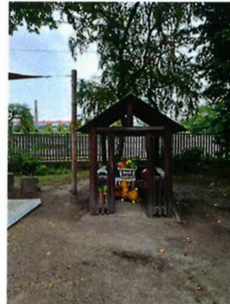
A jelenlegi kisház