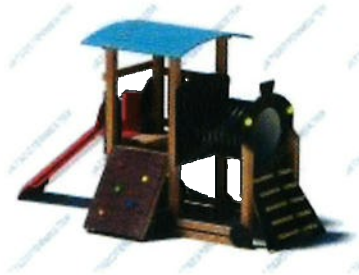
A megvásárolni kívánt játékeszköz

A korábban felajánlott támogatás összegének kiegészítéséhez, a képen látható játékeszköz a beszerzéséhez, megvásárlásához szeretném kérni a támogatását.