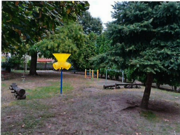
A maci csoport udvara