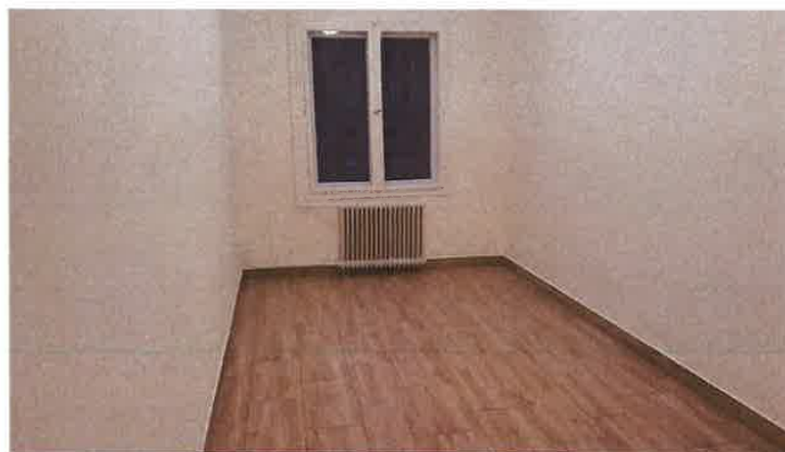
2. ábra: étkezős