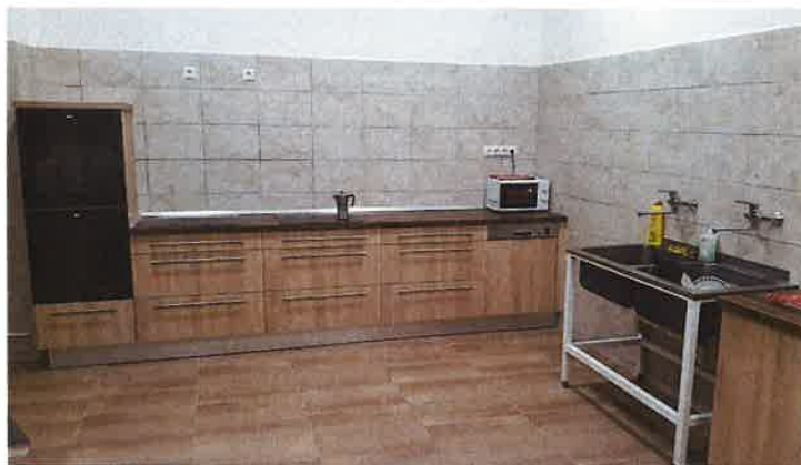
1. ábra: konyha

Igyekeztünk a felújítás során az egyszerű, tiszta formákat keresni és a könnyen karbantartható anyagokat használni.