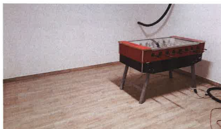
3. ábra: közösségi szoba