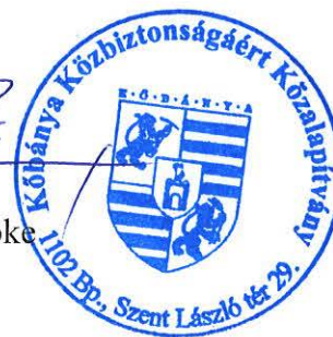
Tóth Béla a kuratórium elnöke