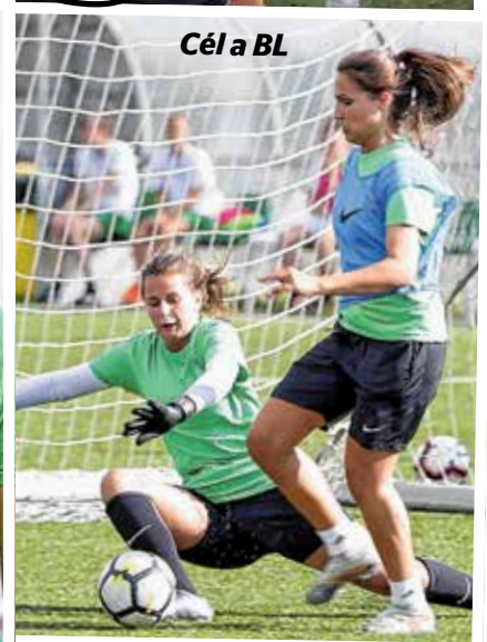
Cél a BL

a szerződést, csakhogy olyan országból érkezne, amelyet járványügyi szempontból a legveszélyesebbek közé soroltak a magyar hatóságok. Beutaztatásához tucatnyi engedélyre lenne szükség, ha azokat nem tudjuk beszerezni, akkor mással kell megállapodnunk” – hívta fel a figyelmet a nem várt nehézségre az edző, aki összességében elégedett volt az első edzésen látottakkal.