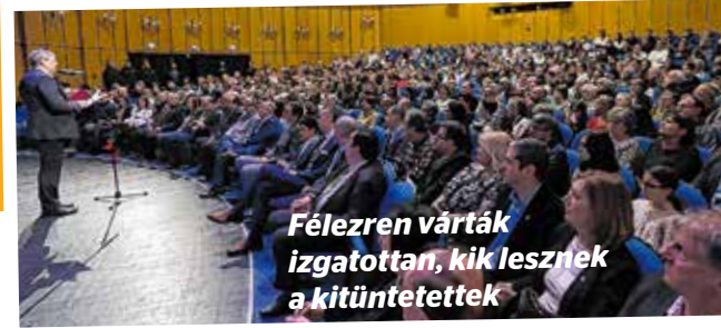
Félezeren várták izgatottan, kik lesznek a kitüntetettek