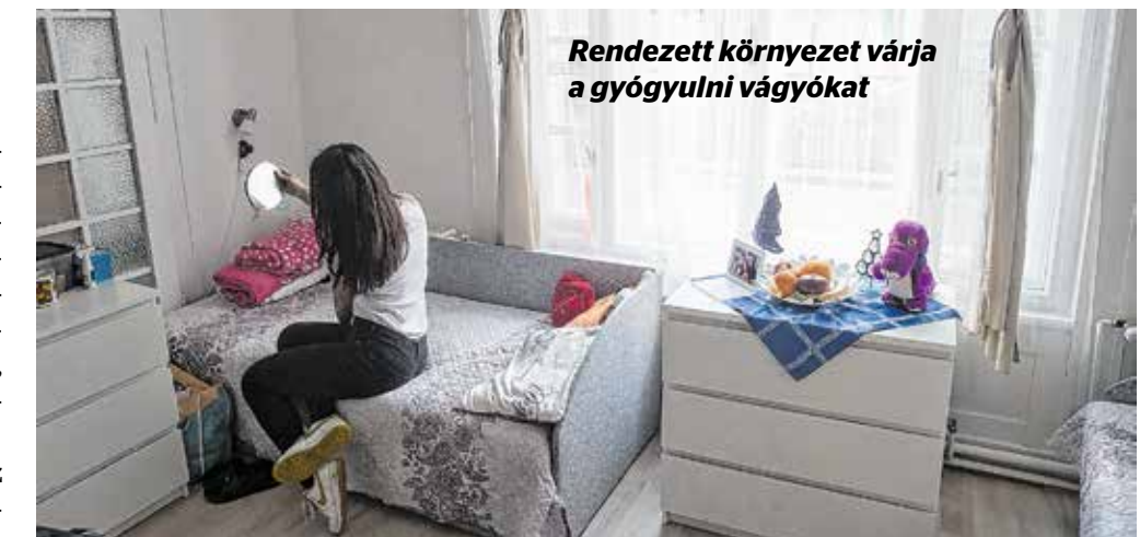
Rendezett környezet várja a gyógyulni vágyókat