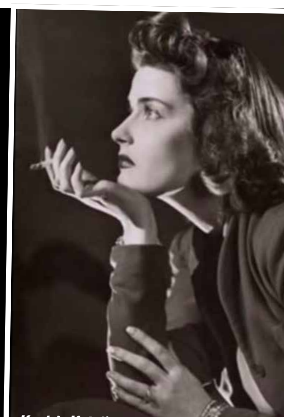
Karády Katalin a modern nő eszményképe volt

Ám a német hatalomátvétel után a Gestapo fogságában eltelt hónapok ellenére sem lett a háború után formálódó rendszer kegyeltje. Az új világnak ilyen szereplőkre nem volt szüksége, ezért 1951-ben – sejtethetően a kommunista ha-