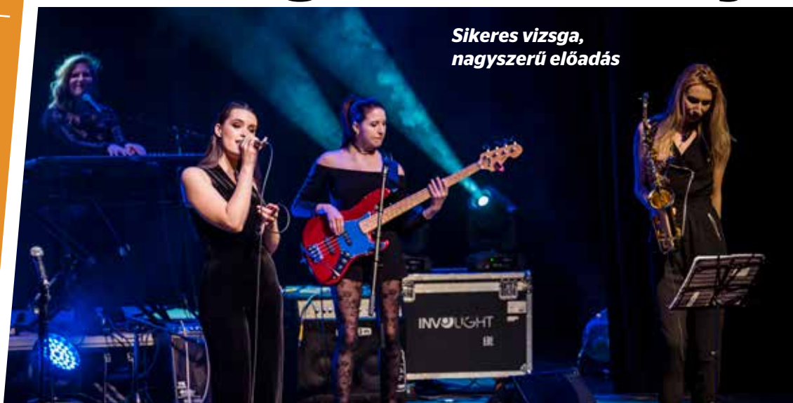
Sikeres vizsga, nagyszerű előadás

Rendhagyó koncertet adott a Kőbányai Zenei Stúdió a Körösi Kulturális Központ színpadán január végén. Az ingyenes rendezvényen azok az osztályok, azaz zenekarok léptek fel, amelyeket a félévi vizsgán a tanári kar a legjobbnak talált vizsgaelőadásuk és féléves munkájuk, szorgalmuk alapján. Hallgatva a dalokat, nem lehetett könnyű dolguk az ítéseknek, mert minden produkció erőteljes és különleges volt. A mű-