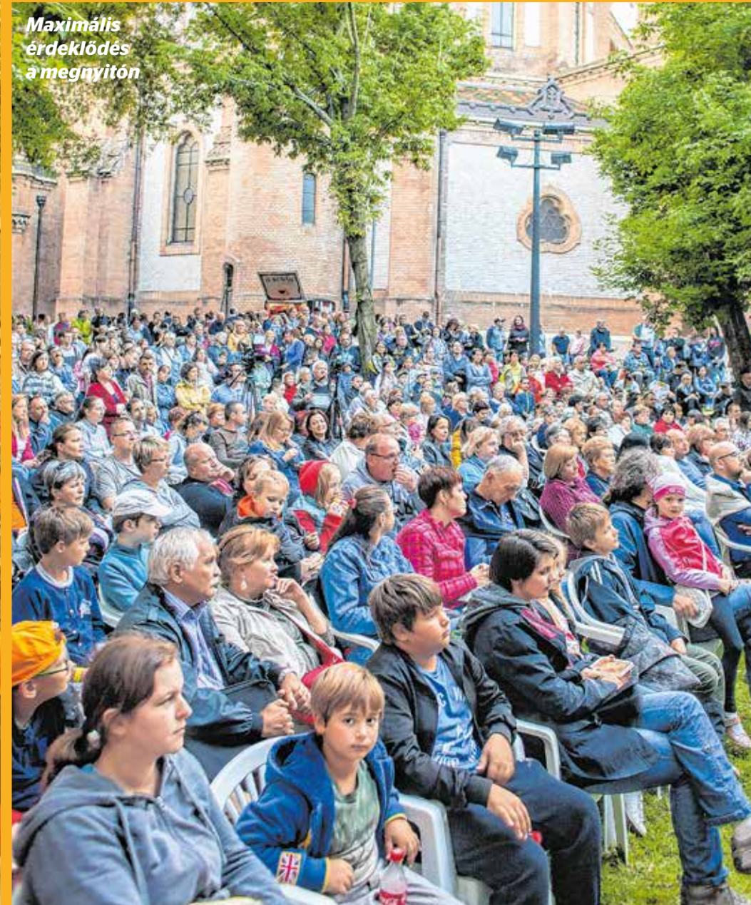
Maximális érdeklődés a megávitón

Az eddigi egyik leggazdagabb és legszínesebb Szent László napi ünnepségben lehetett részük kicsiknek és nagyoknak Kőbányán. Június 21-e és 24-e között több tucat ingyenes program várta a közönséget a Szent László téren a város védőszentjének tiszteletére tartott fesztiválon. A Kőbányai Önkormányzat és a Kőrösi által szervezett ünnepségen mindenki megtalálta a magának kedves programot: koncertek és színpadi darabok, hagyományörző foglalkozások, kulturális ismeretterjesztő előadások várták az érdeklődőket.