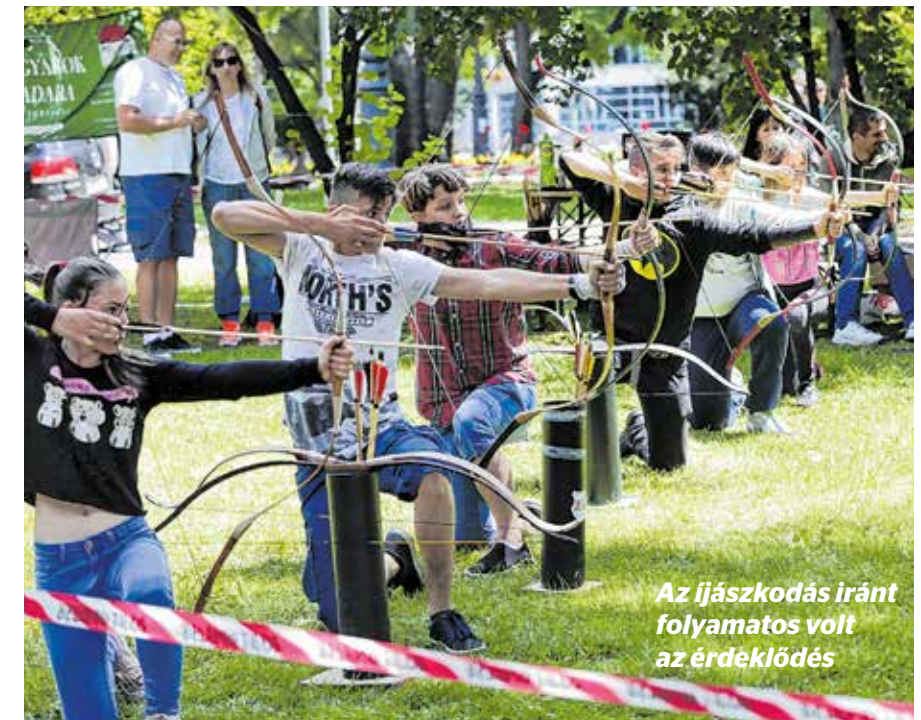
Az íjászkodás iránt folyamatos volt az érdeklődés

másutt tízzománc medál készült, vagy színes koronákat ragasztottak. A szervezők szándékai szerint az is fontos üzenet volt, hogy a fiatalok a digitális eszközök térnyerésével se feledkezzenek meg a kézműves-tevékenységek élvezetéről, az együtt töltött idő örömeiről. Idén a gyermekek körében a legnépszerűbb a „kisvasutazás” volt. A félóránként indított Varázslatos Zenevonat különleges kőbányai körútra vitte a vidám utasokat, akiket közben interaktív koncert szórakoztatott. Mivel a családok nagy érdeklődéssel várták a renthagyó lehetőséget, a szervezők úgy döntöttek, a fesztivál utol-