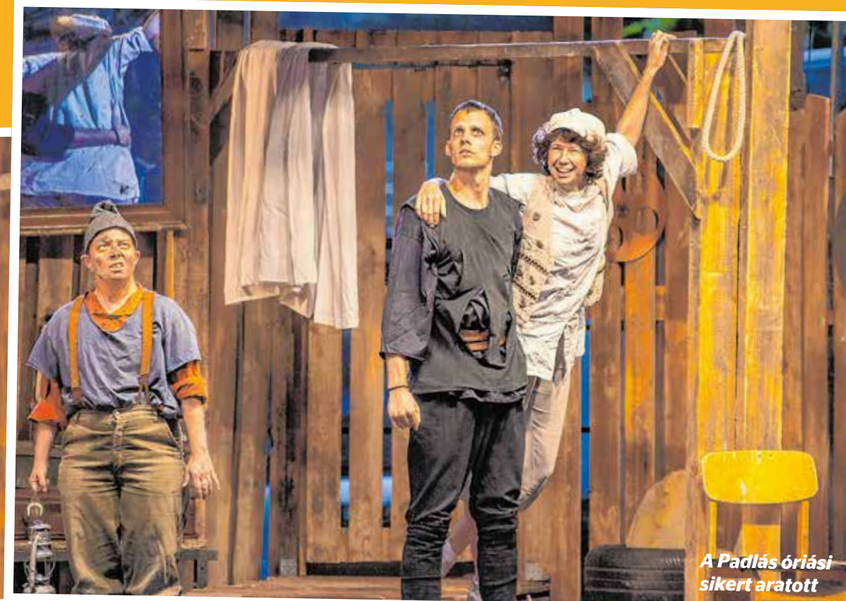
A Padlás óriási sikert aratott