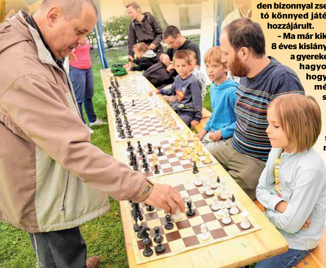
– Ma már kikaptam egy 8 éves kislánytól, persze a gyerekeket inkább hagyom nyerni, hogy a sikerélmény erősítse az érdeklődésüket – mondta a többszörös bajnok, akire egykor az elmesapja által ragadt az elmesport iránti rajongás.

Bár a hét vége felé hűvöse fordult az idő, mindez nem szegte kedvét a kőbányaiaknak: a kerület minden részéből látogattak el kicsik és nagyok a Szent László Napokra. Az idei kulturális, gasztronómiai és helyi kézműveshagyományokat felelevenítő ünnepi rendezvény a Szent László téren egy bensőséges kerületi piknik hangulatát idézte régi jó ismerősök, lokálpatrióta kőbányaiak részvételével. A csütörtöki kiállítás megnyitókát és a díjátadókat követően a főtéren már péntek délutántól vonzotta a helyieket a színpad. A Kőbánya Blues Band és a P.KABL.NET koncertje után, illetve D. Kovács Róbert