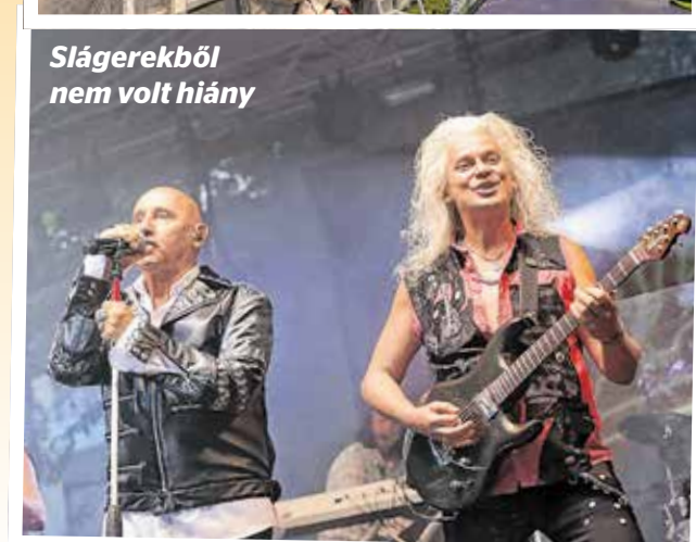
Slágerekből nem volt hiány