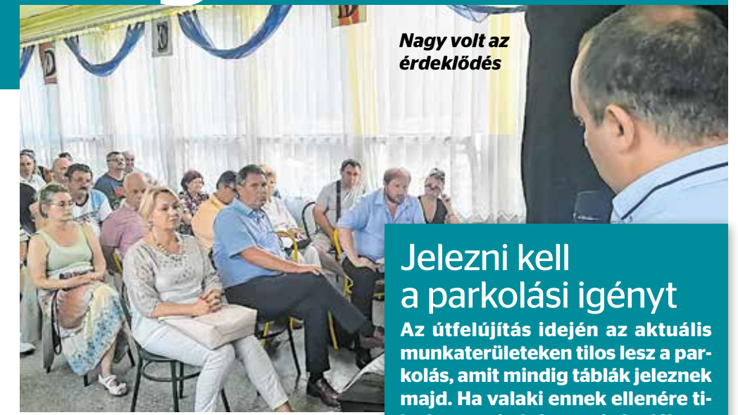
Nagy volt az érdeklődés

A lakossági fórum helyszínénél szolgáló Keresztury iskola felújításával kap-