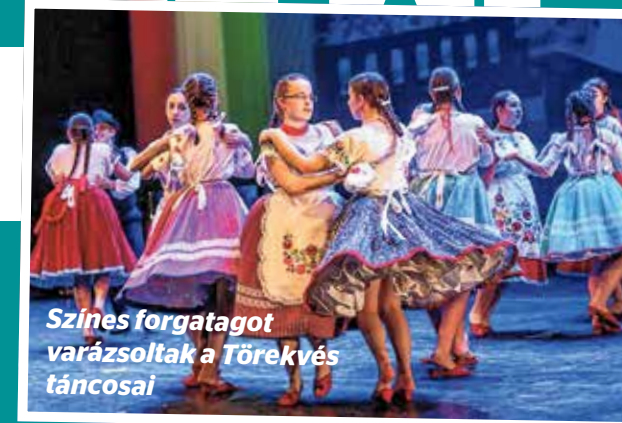
Színes forgatógot varázsoltak a Törekvés táncosai

Színes forgatógot varázsolt a színpadra a Törekvés Táncgyűttes Sutytyó csoportja. A legjobb táncosportot öt fiú és tizenöt lány alkotja, s igazán nem voltak lámpalázzal vádolhatóak, hiszen egyre több a fellépésük, színpadra álltak márclusbán is, a Művészetek Palotájában, amikor a Törekvés Művelődési Központ fennállásának 130. évét ünnepelte. Szintén első helyezést nyertek a különleges előadások kategóriájában a Kőmázsik Bábcsoport, míg a Harmat Gyermekkar 25 ezer forintos Media Markt utalvánnyal gazdagodott mint közönségdíjas.