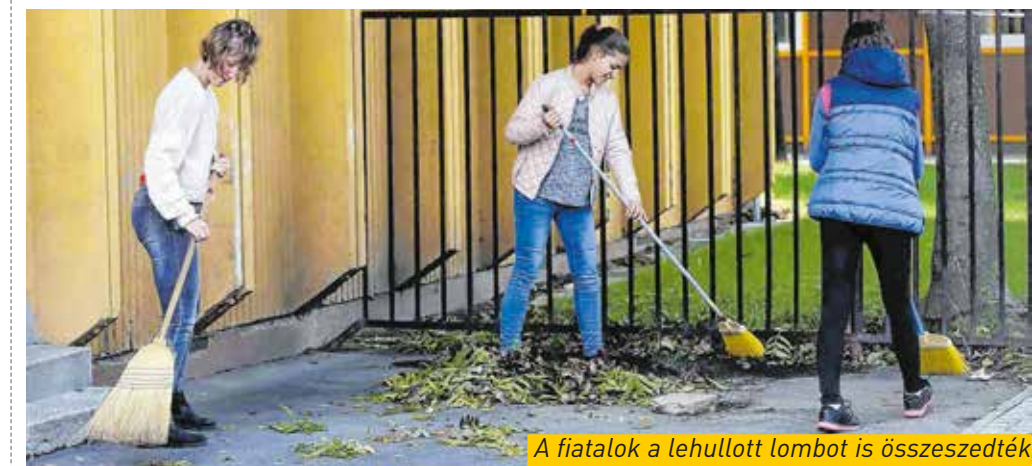
A fiatalok a lehullott lombot is összeszedték