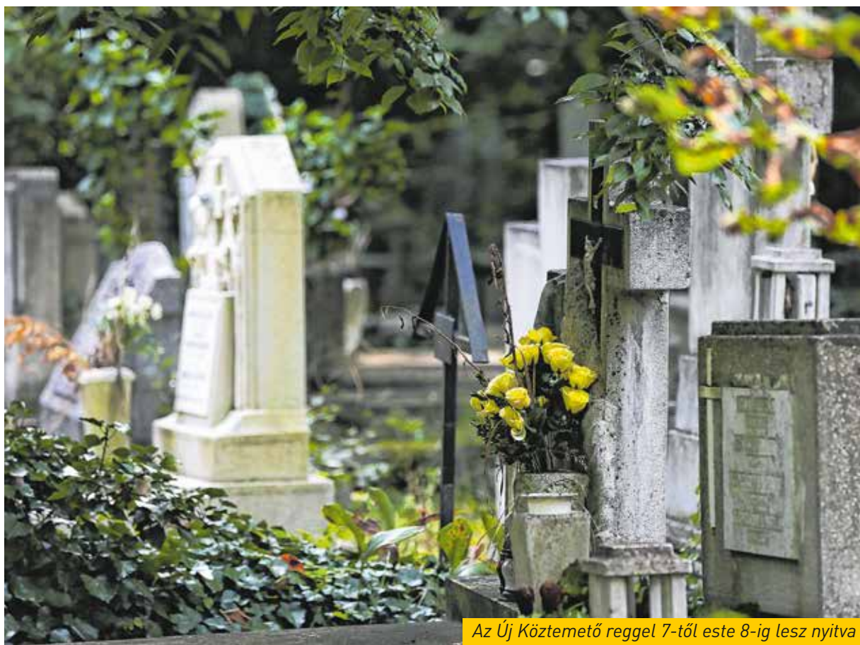
Az Új Köztemető reggel 7-től este 8-ig lesz nyitva