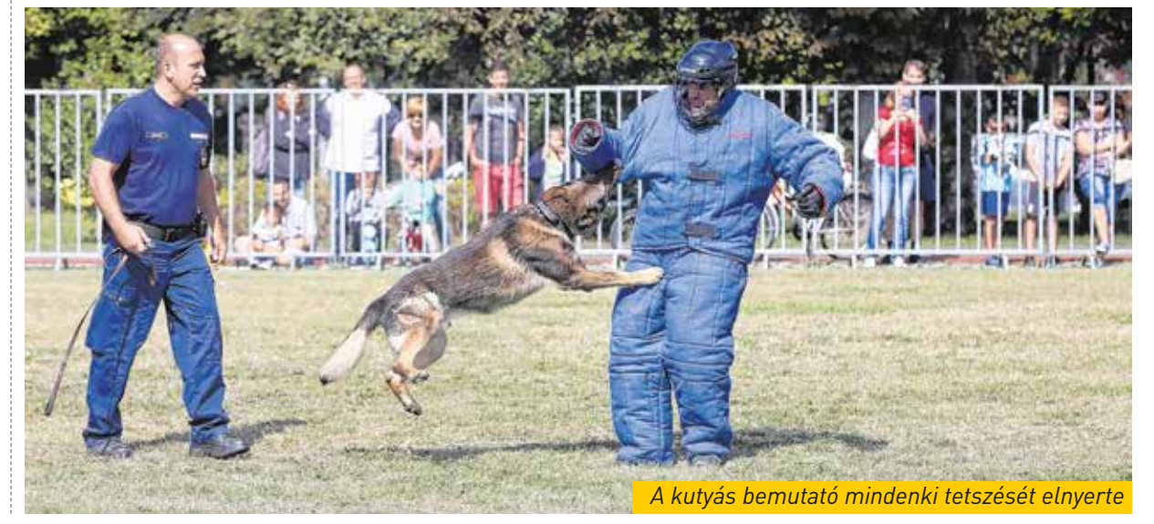
A kutyás bemutató mindenki tetszését elnyerte

gyülteket, majd következtek a műsorok és előadások a „sátorvárosban” és a szabadtéren. Együtt tornázhattak a vállalkozó szellemű katonákkal, figyelhették a közelharc- és az önvédelmi bemutatót. Hatalmas sikert aratott a készenléti lovas produkciója, valamint a tűzoltóság parádés bemutatója aratta a legnagyobb sikert.