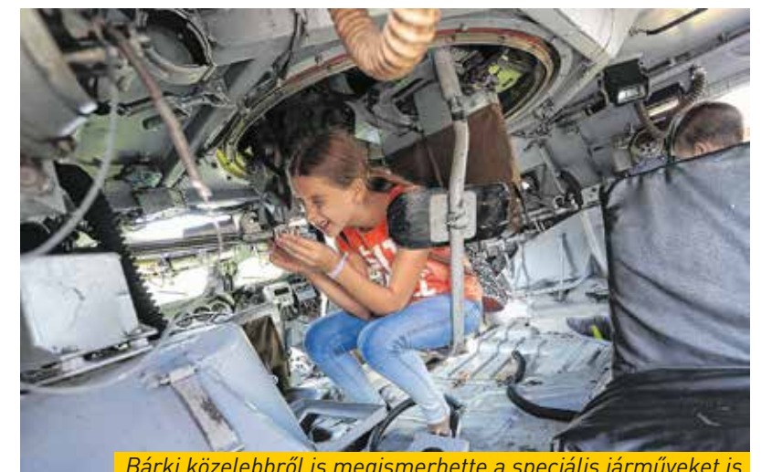
Bárki közelebről is megismerhette a speciális járműveket is

Már tizedik alkalommal rendezte meg az önkormányzat a Kőbányai Rendvédelmi Napokat az Óhegy parkban szeptember első hétvégéjén. A rendezvényen a látogatók testközelben ismerkedhettek meg a rendőrséggel, a tűzoltósággal, a katasztrófavédelemmel, a polgárőrséggel, a katonasággal és más rendvédelmi feladatokat ellátó szervezetek munkájával.