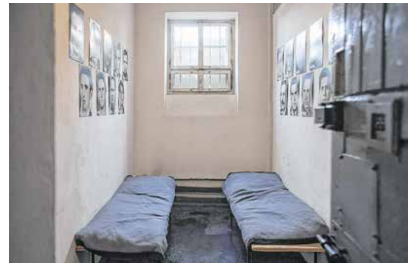
A síralomház eredeti berendezése a zord körülményeket tükrözi

Az idei az első alkalom, hogy az 1956-os forradalom és szabadságharc megemlékezésén nem lesz jelen Fónay Jenő. A Politikai Foglyok Szövetségének alapító elnöke 2017. június 16-án elhunyt. Az '56-os halálraítélt szabadságharcos a rákoskeresztúri Új Köztemető 300-as parcellájában nyugszik.