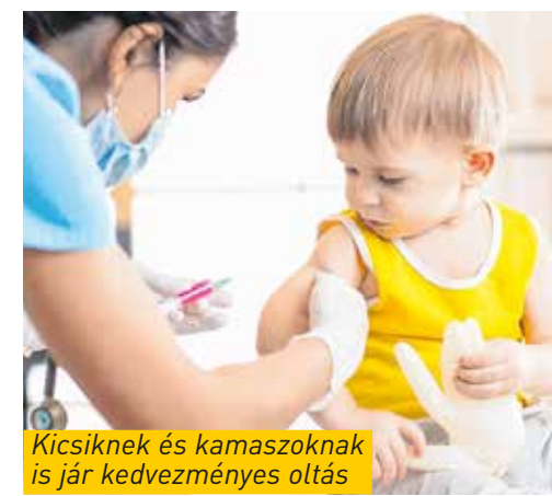
Kicsiknek és kamaszoknak is jár kedvezményes oltás