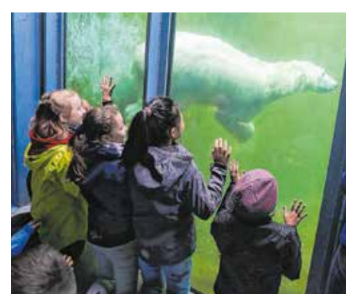
A kicsik egyik kedvence a medencéjében úszkáló jegesmedve volt

rázskaraván vendégeit, akiket a séta végzetével egy kis uszonnára is megvendéglátott: a gyerekek szendvicset és üdítőt kaptak.