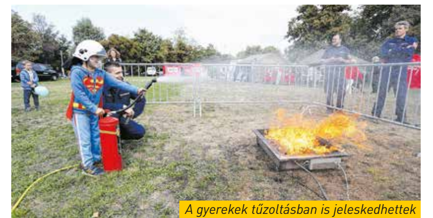
A gyerekek tűzoltásban is jeleskedhettek

Szombaton reggel az Újhegyi sétány és a Kőrösi sétány közelében élők térzenére ébredhettek a Készenléti Rendőrséggel, valamint a katasztrófavédelem zenekarainak jóvoltából. Az Óhegy parki látogatók sem maradtak le a zenéről, mert a rendőrség ott is megcsillogtatta tudását.