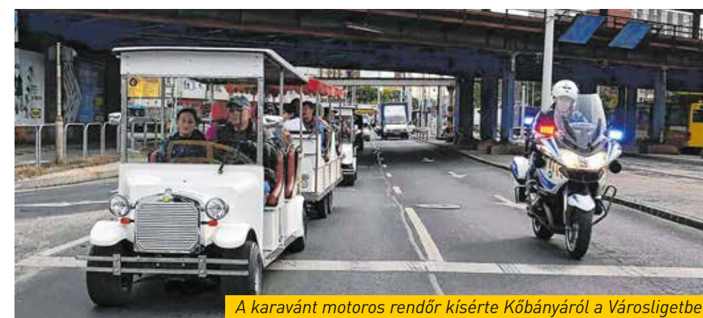
A karavánt motoros rendőr kísérték Kőbányáról a Városligetbe