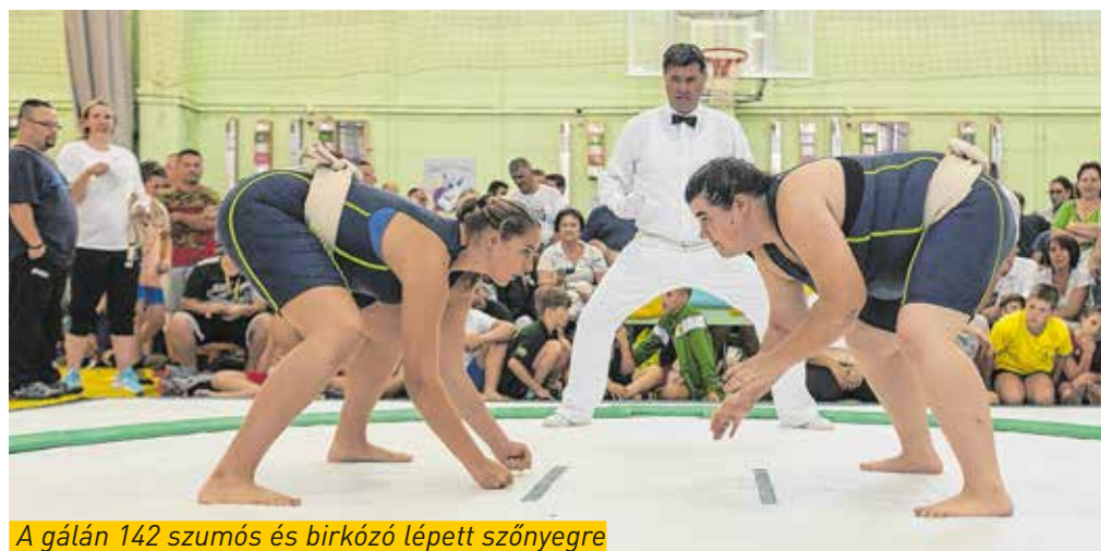
A gálán 142 szumós és birkózó lépett szőnyegre

A Kőbánya SC birkózó- és szumógálát rendezett a Kocsis Sándor Sportközpontban. A két sportág 142 versenyzője lépett szőnyegre, a szumóverseny egyben az U12 és U21 korosztályok országos bajnoksága, valamint válogatója volt a közeledő Eb-re.