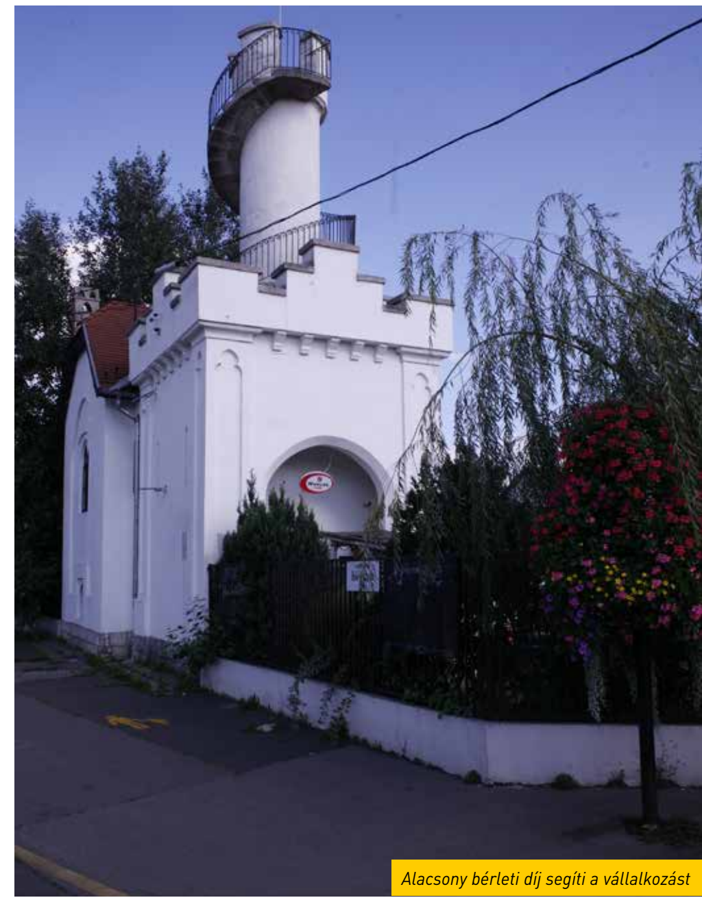
Alacsony bérleti díj segíti a vállalkozást

Megújuló utcák, gyarapodó parkolók, sebességkorlátozás