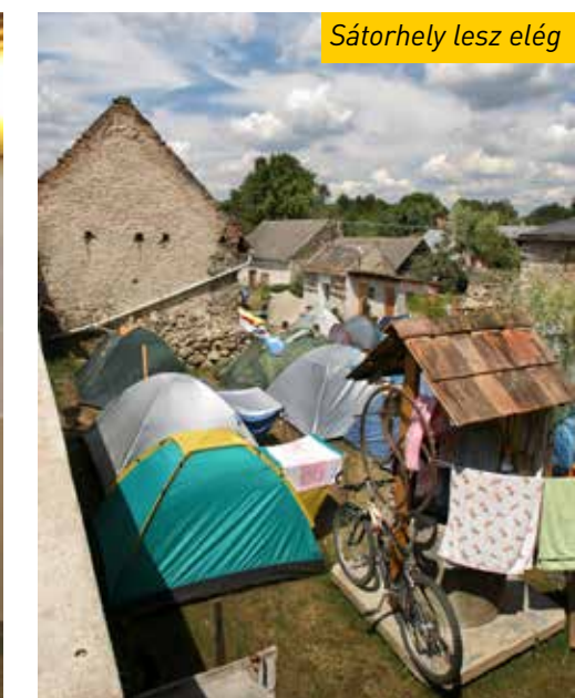
Sátorhely lesz elég