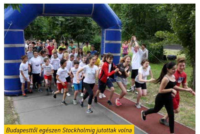
Budapesttől egészen Stockholmig jutottak volna