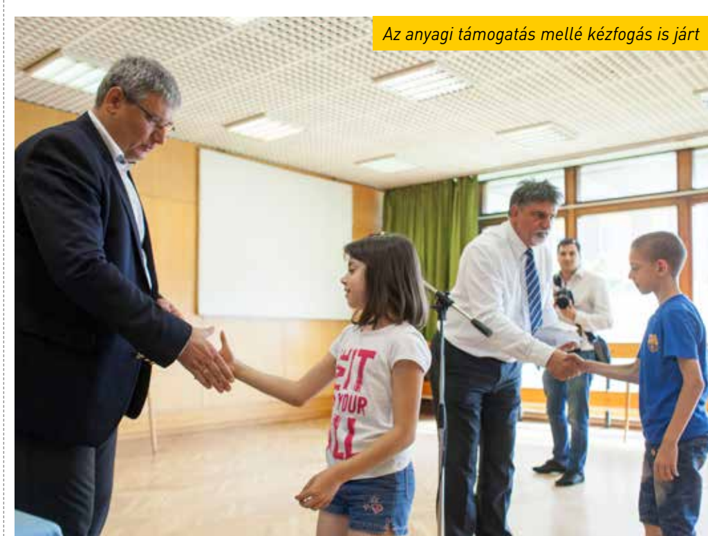
Az anyagi támogatás mellé kézfogás is járt

Idén is 100 kőbányai és 100 kispesztí gyermek nyári táborozását támogatja dr. György István, Budapest Főváros kormánybiztosja a decemberi „Adjunk a hűroknak...” és a rászorulóknak is!” elnevezésű jótékonyági koncertjén összegyűlt 3 millió forint adományból. A Kőbányai Szociális Védegyelet és a Kispesztí Társaság Egyesület pályázatán keresztül gyermekeiként 15 ezer forintos támogatást nyerhettek el a családok, amelyeknek az egy főre jutó jövedelem alapján ítélték meg a támogatást.