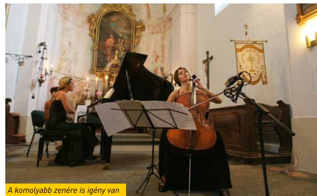
A komolyabb zenére is igény van