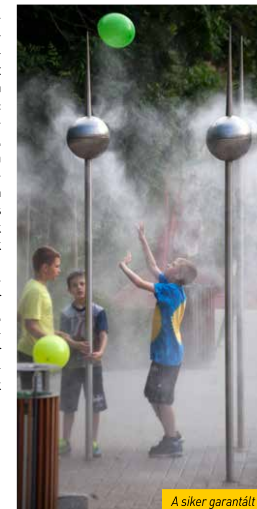
A siker garantált!