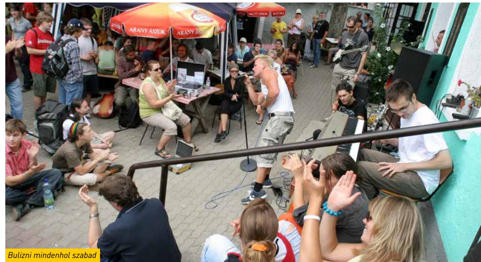
Bulizni mindenhol szabad