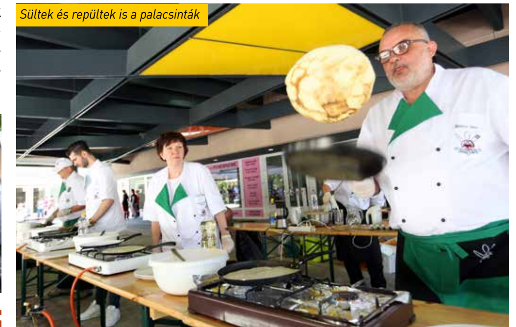
Sültek és repültek is a palacsinták

Igazi színes forgatag várta Újhegyen május utolsó hétvégéjén a családokat. A számtalan változatos programlehetőség mellett a legfőbb érdekesség a palacsintahosszúsági világrekord megdöntése volt.