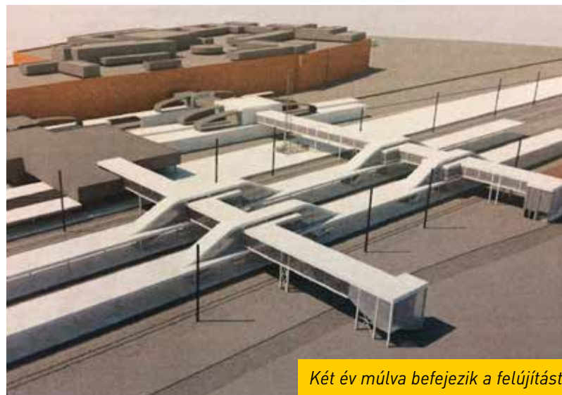
Két év múlva befejezik a felújítást