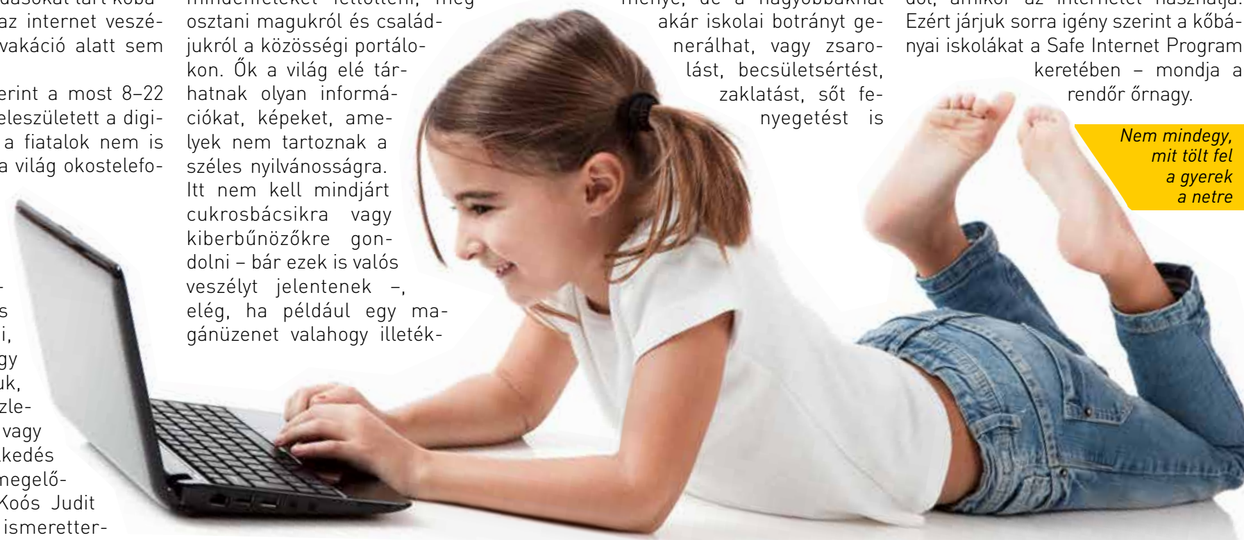
Nem mindegy, mit tölt fel a gyerek a netre

A már tapasztaltabb, középiskolás korosztályt általában másféle veszélyek fenyegetik. Ők már kínosan ügyelnek arra, hogy a saját korosztályukkal folytatott digitális kommunikáció ne hogy a felnőttek látókörébe kerüljön. Náluk a szülői kontroll nélküli internethasználat és kommunikáció része a felnőtté válásnak, ebbe jobb belenyugodni. Viszont nagyon is fontos, hogy ők is hiteles forrásból ismerjék meg azokat a buktatókat, amelyekre senki nem gondol, amikor az internetet használja. Ezért járjuk sorra igény szerint a kőbányai iskolákat a Safe Internet Program keretében – mondja a rendőrőrnagy.