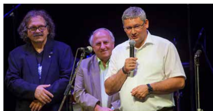
Kovács Róbert polgármester (jobbra) továbbra is számít a zenészekre

Igazi görcsmentes örömenélést csaptak a Kőbányai Zenei Stúdió diákjai az intézmény 19. évzáró gáláján, a Kőrösi színpadán.