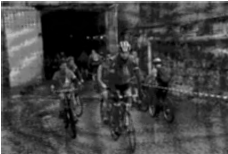
A Kőbányai Autómentes Napon a bányából kitekerve