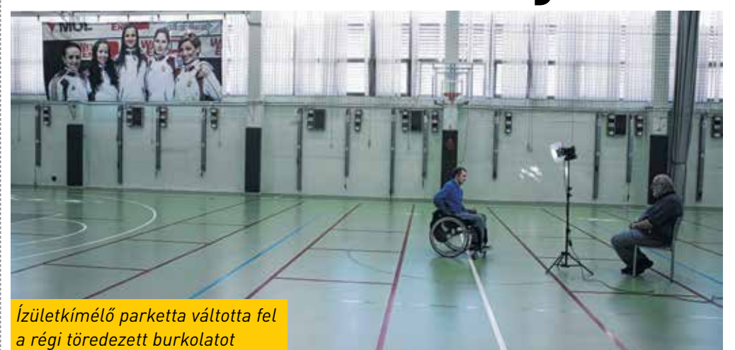
Ízületkímélő parketta váltotta fel a régi töredezett burkolatot

Senki sem bízott benne, Kőbánya mégis bizonyított: bár a vívásnak a közelmúltban nem voltak hagyományai, mára a sportág egyik legjobb bázisává alakult a Törekvés. Már most kadett, junior és lassan már felnőtt világbajnoki versenyzői is vannak az egyesületnek. Nap mint nap 111 gyerek jár a megújult vívócsarnokba, amely összesen 16 millió forintból készült. A korábbi, balesetveszélyes, töredezett burkolatot ízületkímélő, legmodernebb parketta váltotta föl, így a korábbinál sokkal nagyobb biztonságban készülhetnek a bajnokjelöltek. A klubot 1999-ben alapították, és lényegében a semmiből fejlődött az utánpótlás legnagyobb bázisává.