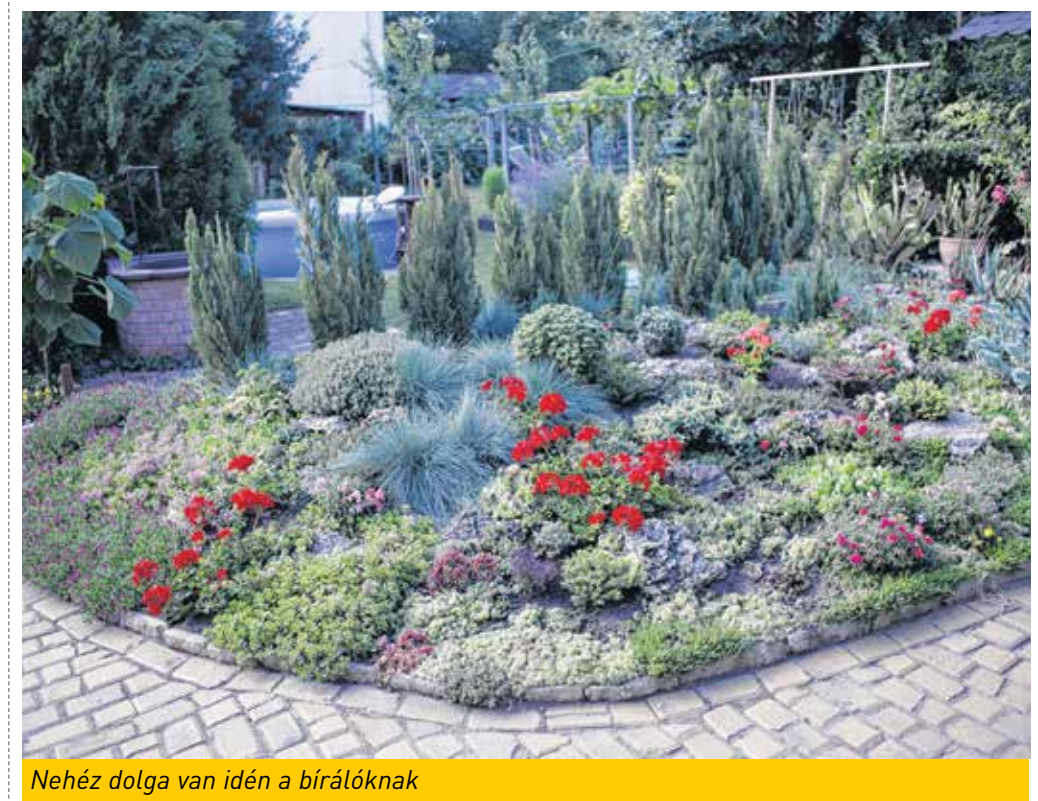
Nehéz dolga van idén a bírálóknak

Soha ennyi dolga nem volt a bírálóknak, mint az idén a Tiszta udvar, rendezés ház! című pályázaton. Már tavaly is több mint 450 kertet szemléltek végig, szebbnél szebbeket, most azonban várhatóan szelektálniuk kell majd a lehetséges nyertesek közül. A gyakorlat szerint ugyanis a tavaszi virágosításra jelentkezők közül keresik a leendő „táblatulajdonosokat” – a lakossági jelölések mellett –, ebben az évben azonban olyan sokan kértek a virágokból, hogy képtelenség valamennyiüket szemrevételezni. Ráadásul a dolguk is egyre nehezebb: évről évre ugyanis egyre szebbek a kertek. Tavaly 136 plakettet osztottak, idén is nagyjából ennyien kaphatják