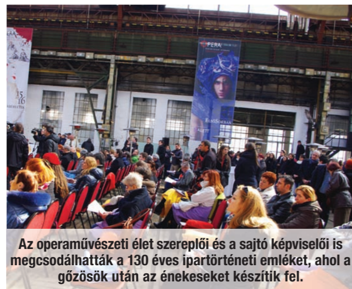
Az operaművészeti élet szereplői és a sajtó képviselői is megcsodálhatták a 130 éves ipartörténeti emléket, ahol a gőzösök után az énekeseket készítik fel.

olyan bázis kiépítése, amely minden raktár és műhely egyesítésével, két próbaszínpaddal, egy stúdió-képességű zeneteremmel támogatja az Operaház jelenleg lehetetlen felkészülési körülményeinek javítását. Az Andrásy úti épület és az Eiffel-csarnok újjáépítése kulcsfontosságú, ám eközben a művészek arra is figyelnek, hogy Európában egyedülálló repertoárral szolgálják a közönséget.