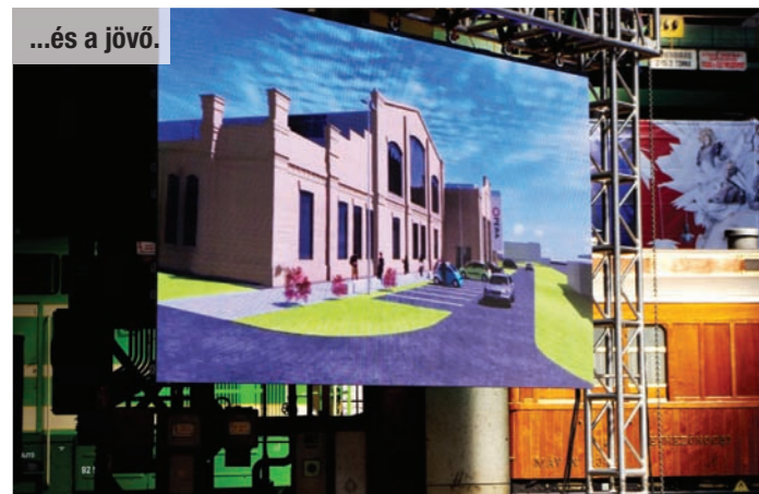
...és a jövő.

A MÁV Kőbányai út 30 szám alatt található Északi Járműjavító Telepe hajdan a magyar vasúti közlekedés legendás üzeme volt, amelyet még az 1870-es években alapítottak. E nemes helyen egykor a vasúttörténet nagy nevével járművei fordultak meg, hogy elvégezzék rajtuk a szükséges javításokat. 1885-re épült fel a 20 ezer négyzetméter alapterületű nagy, gőzmozdonyjavító-csarnok, az Eiffel-csarnok, ahol a két világháború között körülbelül négyszáz gőzmozdony született újjá. A második nagy világháború idején megközelítően háromezren dolgoztak itt és a telep bővítéseként 1967-ben még egy, az Eiffel-csarnokhoz hasonló nagyságú dízelmozdony- és motorkocsi javító épületet adták át.