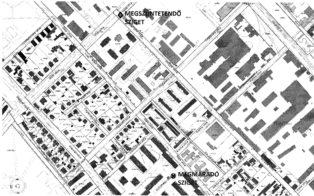
A Budapest X. kerület, Sörgyár utca – Gitár utca csomópontban lévő és a Szőlőhegy utcai parkolóban lévő szelektív hulladékgyűjtő-szigetek elhelyezkedése