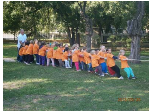
Ovis ügyességi versenyek