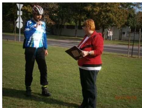
Megálló a Csősztoronynál...