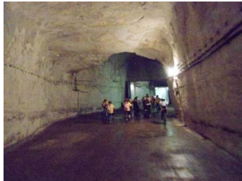
Túra a bányában