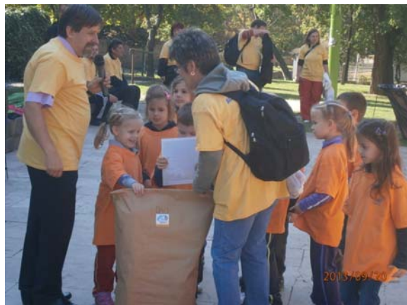
Ajándéksomag átadása a verseny végén – minden óvodának