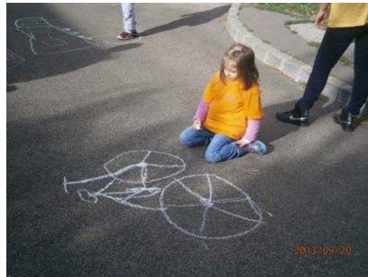
Aszfaltrajz verseny az Ászok utcában