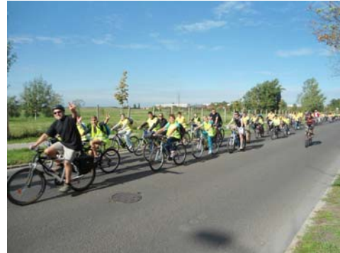
Kerekezés a Mélytó felé a Harmat utcában