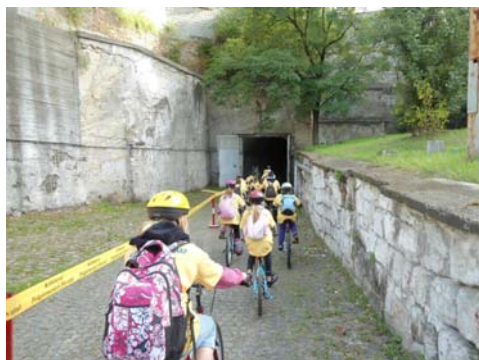
Útban az Előd utcai bányajáráthoz

Hagyományteremtő kezdeményezéssel az idei túra során a kerékpárosoknak néhány kerületi látnivalót is bemutatunk: először a Bánya utcai pincerendszer egy részén hajtottak át a résztvevők, majd a Csósztoronynál és a Mélytó melletti Téglamúzeumnál állt meg a csapat egy-egy rövid helytörténeti tájékoztatóra.