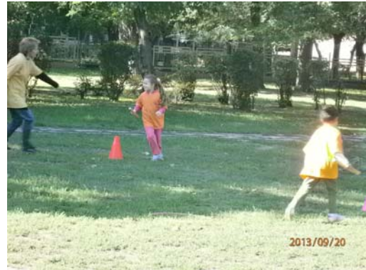
Ovis ügyességi versenyek