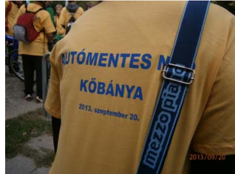
Kerékpár túra – indulás előtt

Az óvodások részére a program idejére az „Autómentes Napon” lezárt Ászok utcában és a KÖSZI előtti parkban ügyességi versenyeket tartott a Kőbányai Sportközpont.