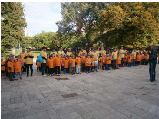
Óvodás program kezdete

Az óvodások részére a program idejére az „Autómentes Napon” lezárt Ászok utcában és a KÖSZI előtti parkban ügyességi versenyeket tartott a Kőbányai Sportközpont.