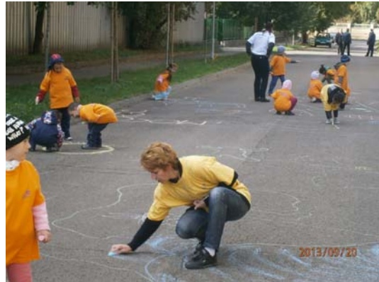
Ovis aszfaltrajz verseny