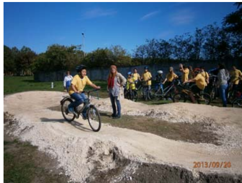
Sportligeti új „pumpa-pálya” – első próbálkozások az ügyességi versenyben

Hagyományteremtő kezdeményezéssel az idei túra során a kerékpárosoknak néhány kerületi látnivalót is bemutatunk: először a Bánya utcai pincerendszer egy részén hajtottak át a résztvevők, majd a Csósztoronynál és a Mélytó melletti Téglamúzeumnál állt meg a csapat egy-egy rövid helytörténeti tájékoztatóra.