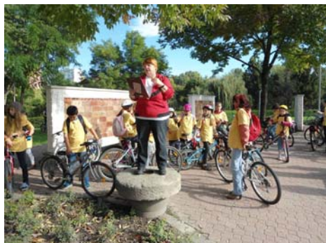
... és a Téglamúzeumnál