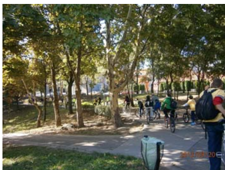
Bringázás a Mélytó körül

A tájékoztatókon elhangzottakat a Kőbányai Helytörténeti Gyűjtemény által összeállított totó kitöltésénél hasznosíthatták a diákok. A szellemi vetélkedést KRESZ totóval és kirakós játékkal segítette a X. kerületi Rendőrkapitányság. A résztvevőknek vidám perceket okozott a „részeg szemüveg” kipróbálása is. Az Autómentes Nap egyik kiemelt célkitűzésére – a levegőtisztaság javítására – a Kőbányai Polgármesteri Hivatal szakemberei vidám környezetvédelmi totója hívta fel a gyermekek figyelmét.