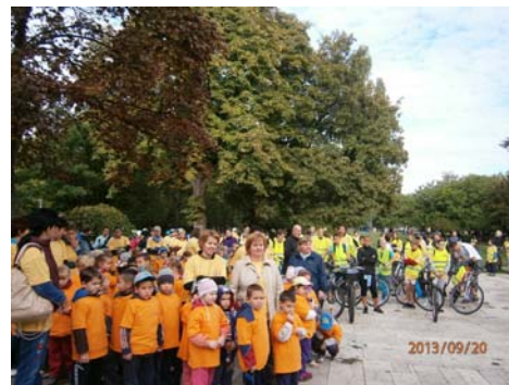
KÖSZI előtti gyülekezés