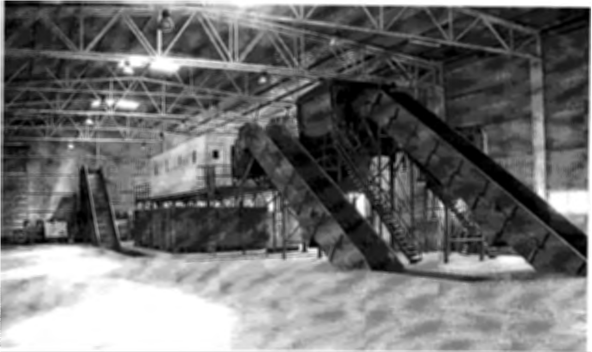
a kép illusztráció - AVOS válogatómű Vaskút