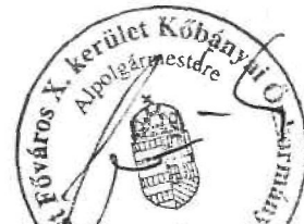
Verbai László polgármester Budapest Főváros X. kerület Kőbányai Önk. Fenntartó képviselőként

Ellenjegyzem: KÓKERT Kőbányai Kerületgondnoksági és Településüzemeltetési Non-profit Közhasznú Kft. 1107 Budapest, Bása u. 1. Adószám: 14324130-2-42 Bankszámlaszám: 11710002-20205056 2.