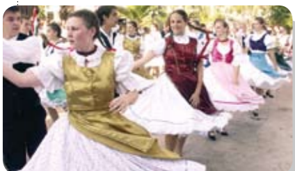
Fellépés Altinluk városában

Kétnapos utazás után érkeztek meg a Törekvés Táncegyüttes Suttó csoportjának táncosai a törökországi tengerpartra (Küçükkyu), közben megállva Isztambulban megtekintették a város látványosságait. Szálláshe-lyünkön szép látvány fogadott: a gyönyörű kék tenger, a homokos part, a változatos növényekkel teli kert egyaránt lenyűgözött bennünket. Ottlétünk alatt három fellépésünk is volt – ezek mind-egyike Altinluk városában –, amelyeken nagy sikert arattunk. Fájó szívvel, de telis-tele szép emlékekkel indultunk el Erdély egyik legszebb vidékére, a Gyimesek völgyébe, Gyimesközépkokra, Borospatakára.