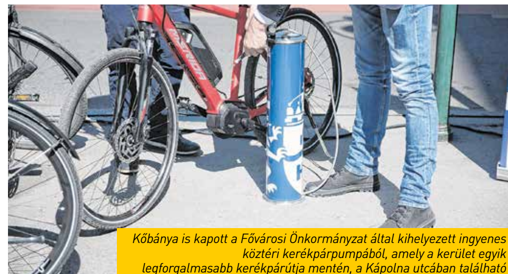
Kőbánya is kapott a Fővárosi Önkormányzat által kihelyezett ingyenes köztéri kerékpárpumpából, amely a kerület egyik legforgalmasabb kerékpárútja mentén, a Kápolna utcában található