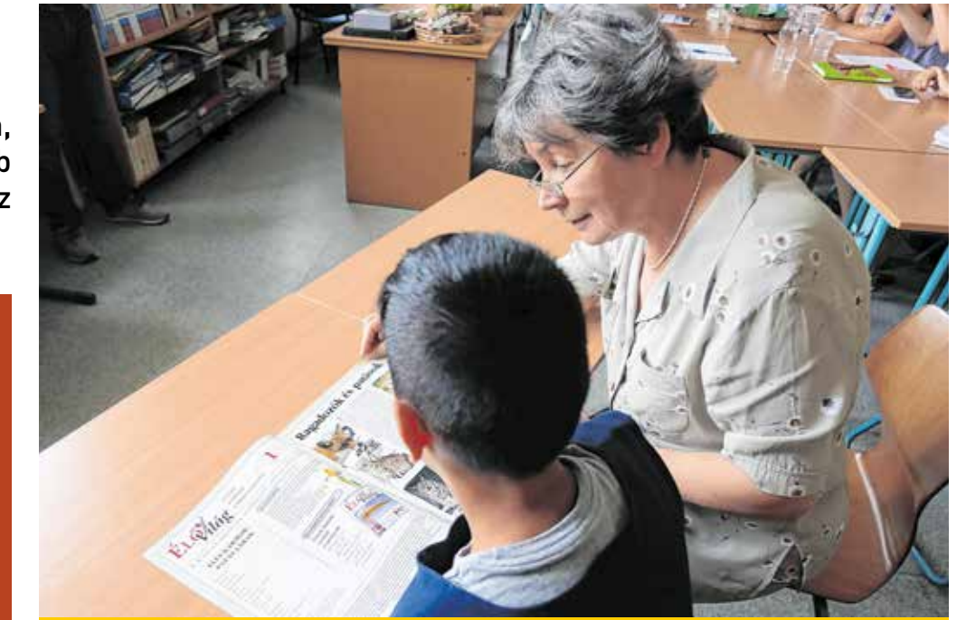
Nincs különösebb megkötés, a nyugdíjas diplomástól azt várják, hogy szeresse a gyerekeket

Fónagy Erzsébet szerint egyre több kisiskolásnál tapasztalható figyelemza-