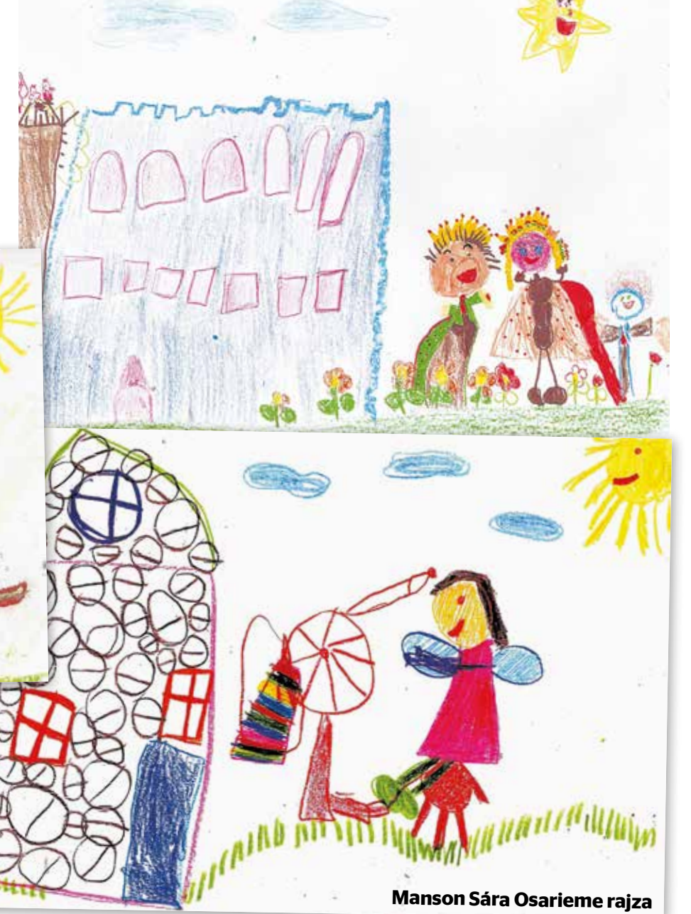
Manson Sára Osarieme rajza