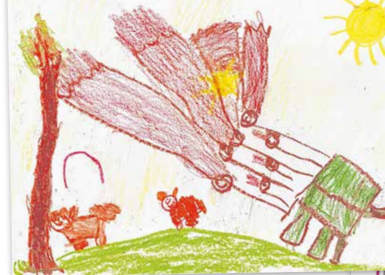
Makó Gábor Levente rajza

– Hogy jutunk be? – kérdezte suttogva a herceg.