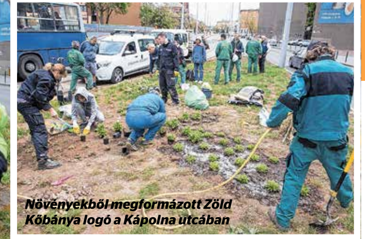
Növényekből megformázott Zöld Kőbánya logó a Kápolna utcában

Mint hosszú évek óta minden esztendőben, a Kőbányai Önkormányzat idén is Föld-napi akciót hirdetett, hogy a kerület intézményeivel, lakóival, társasházi közösségeivel és cégeivel tisztább és rendezettebbé varázsolja a városrészt. A kerülettakarítást április 26-án, pénteken az iskolák kezdték, s a kezdeményezéshez végül három intézmény – a Wesley János Általános Iskola, a Magyar Gyula Kertészeti Szakgimnázium és Szakközépiskola, illetve a Kőbányai Kertvárosi Általános Iskola – csatlakozott, összesen kilencven diákkal és tanárral.