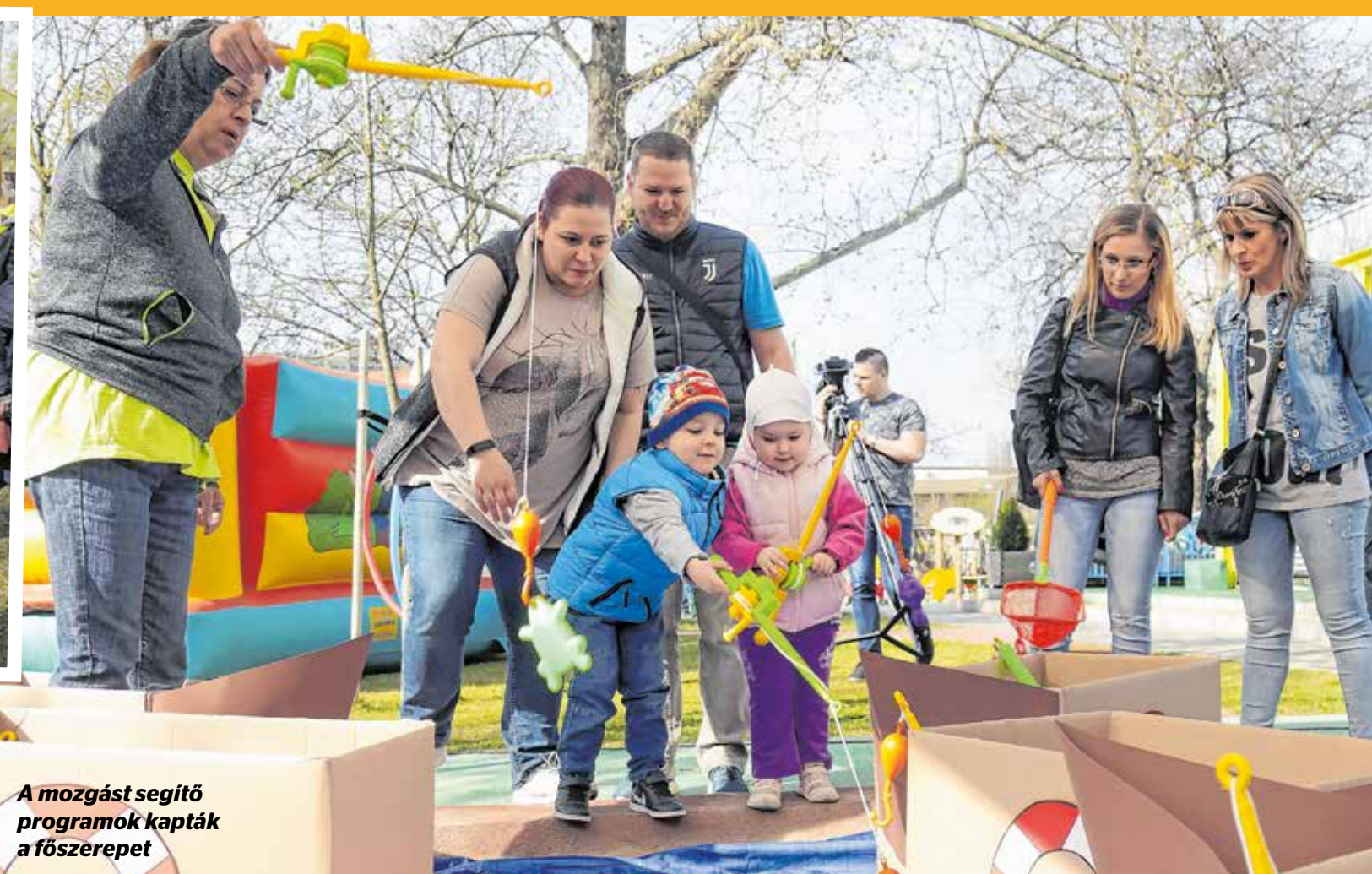
A mozgást segítő programok kapták a főszerepet

dálpályák és egyéb eszközök várták, így a nagy sikerű ugrálóvár. De sokakat vonzottak a kreatív műhelyek, a báb-előadás, az arcfestés is. A szülők számára pedig szakemberek – pedagógusok, orvosok, dietetikusok – tartottak előadásokat.