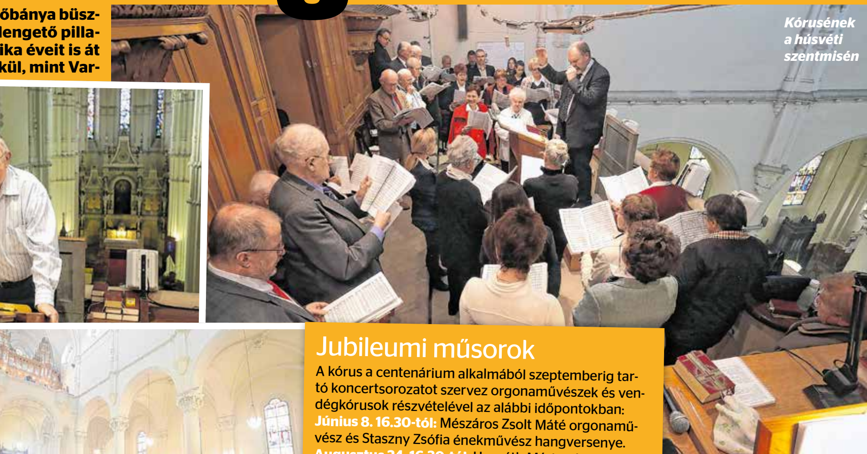
Kórusének a hívsvéti szentmisén