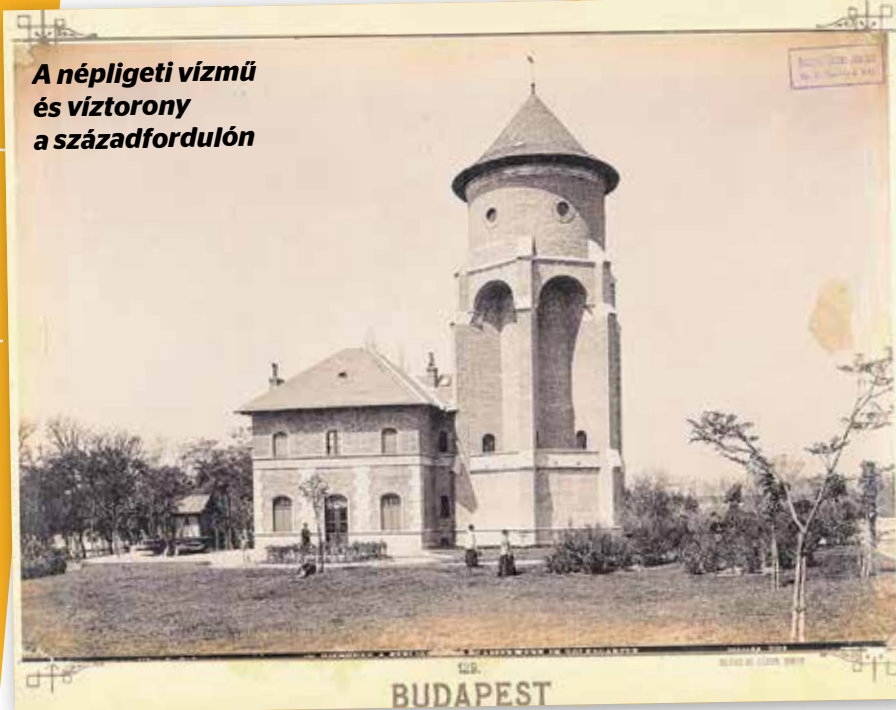
A népligeti vízmű és víztorony a szadzadfordulón