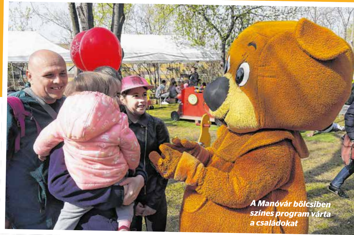
A Manóvár Bölcsőde színes programja várta a családokat

Az ünnepélyes megnyitót követően a család barát programoké volt a főszerep. A családok a rögtönzött konyhákban főzőshow keretében a korszerű étkezés