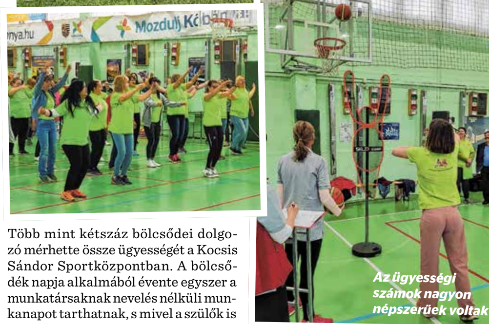
Az ügyességi számok nagyon népszerűek voltak

Több mint kétszáz bölcsődei dolgozó mérhette össze ügyességét a Kocsis Sándor Sportközpontban. A bölcsődék napja alkalmából évente egyszer a munkatársaknak nevelés nélküli munkanapot tarthatnak, s mivel a szülők is jelezték, hogy erre az egy napra maguk oldják meg a csemeték felügyeletét, így a kisgyermeknevelők, dajkák, mosónők és kertészek tőlük is „kimenőt” kaptak.