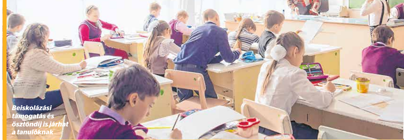
Beiskolázási támogatás és ösztöndíj is járhat a tanulóknak

Külön figyelmet fordít a speciális nevelési igényű gyermekekre a kerület. A Fecskefészek Bölcsődében (Gépmády utca 15.) illetve a Gyermeksziget Bölcsődében (Ujhegyi sétány 15-17.) korai fejlesztő, a Gesztenye ovi-ban autistacsoport működik; s az önkormányzat támogatja a családi bölcsődéket is – ezekben két felnőtt legfeljebb hét gyermekre vigyáz. Két bölcsődeket is – ezekben két felnőtt legfeljebb hét gyermekre vigyáz. Két bölcsődeket is – ezekben két felnőtt legfeljebb hét gyermekre vigyáz. Két bölcsődeket is – ezekben két felnőtt legfeljebb hét gyermekre vigyáz. Két bölcsődeket is – ezekben két felnőtt legfeljebb hét gyermekre vigyáz.