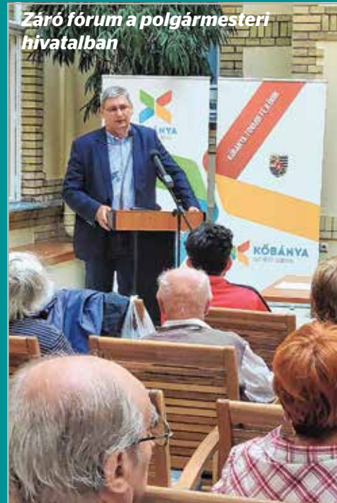
Záró fórum a polgármesteri hivatalban

A lakossági panaszok bejelentésére egyébként több lehetőség is van. A hivatal@kobanya.hu címen e-mailben is meg lehet ezt tenni közvetlenül az önkormányzatnál. Hasonló le-