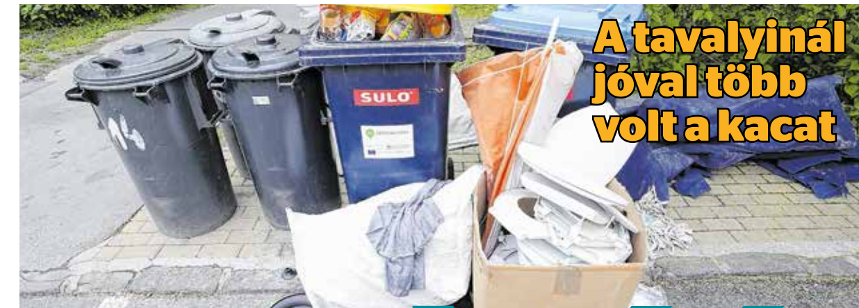
A tavalyinál jóval több volt a kacat