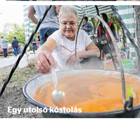
Egy utolsó kóstolás