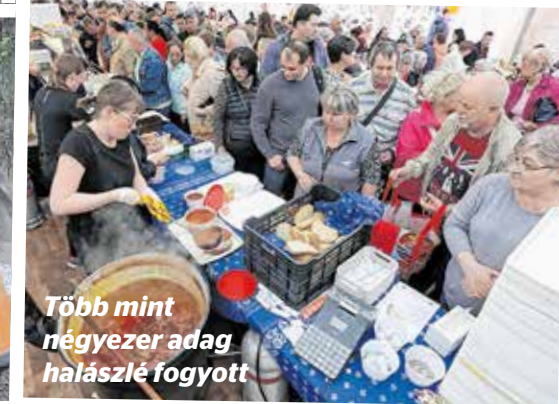
Több mint négyezer adag halászlét fogyott

Idén is egyszerű hangulatban telt a kerület egyik leghangulatosabb rendezvénye, az Óhegy parki Halmajális. Bizton állíthatjuk, hogy a halfőző buli immár „kinőtte” a kerületet, hiszen a különleges eseményre a környező városrészekből is szép számban érkeztek látogatók. Így nem csoda, hogy az egész napos fesztiválon a szervezők becslése szerint mintegy tízezer fordultak meg.