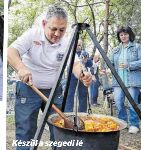
Készül a szegedi lé