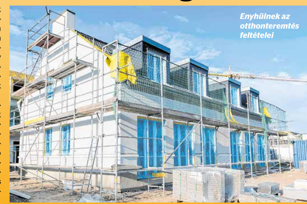
Enyhülnek az otthonteremtés feltételei

A meglévő jelzáloghitel is csökkenthető a gyermekvállalással. Így a második kicsi érkezésével egymillió, a harmadiknál újabb négy millió forint vállalást az állam a hitelből az év második felétől. A további gyermekek esetén újabb 1-1 millió forint adósságelengedésre számíthatnak a szülők. A negyedik gyereket vállalók 2,5 millió forintos támogatásban is részesülnek, amelyet autóvásárlásra fordíthatnak.