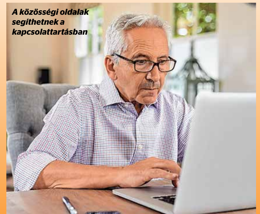
A közösségi oldalak segíthetnek a kapcsolattartásban