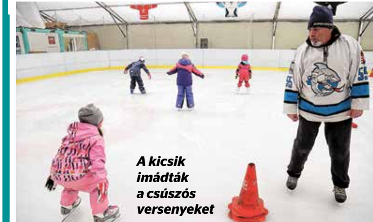
A kicsik imádták a csúszós versenyeket

Nem lehetett panaszuk az amatőr sportolóknak a lehetőségekre október utolsó szombatján. A Mozdulj Kőbánya! keretében a Kocsis Sándor Sportközpont és az önkormányzat a kőbányaiakat egy lazább erőpróbára invitálta: az Óhegy parkban a nordic walking versenyszámot tartották meg.