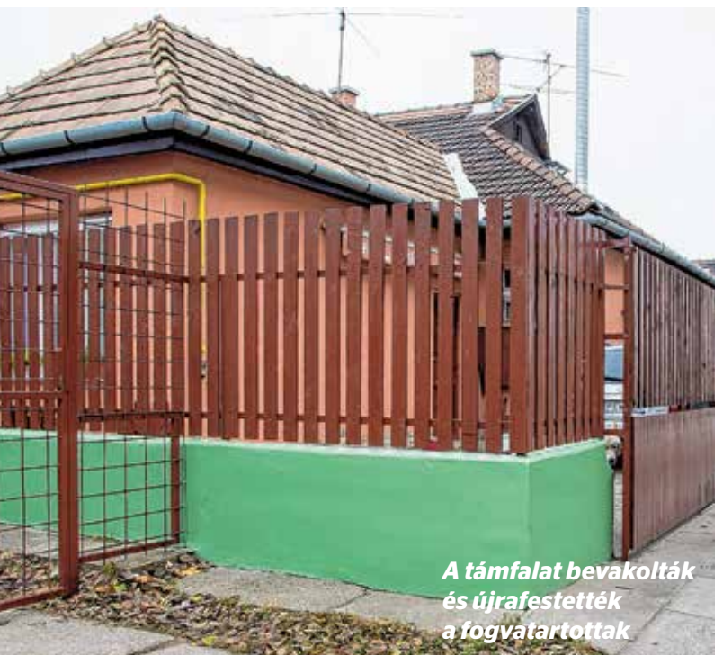
A támfalat bevakolták és újrafestették a fogvatartottak