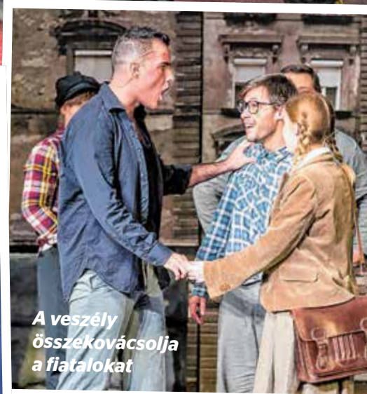
A vesztély összekovácsolja a fiatalokat