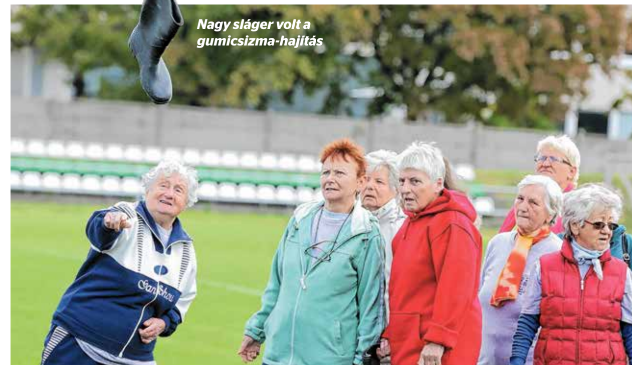
Nagy sláger volt a gumicsizma-hajítás

Az Idősek Hónapjának legenergiusabb programja a korosabbak kis „kőbányai olimpiája”, a Szenior Tízkarikás Játékok. A Kocsis Sándor Sportközpontban tartott rendezvény idén is nagy sikert aratott, hiszen a közös mozgás és a barátságos versengés mellett rengeteg díj is gazdára talált.