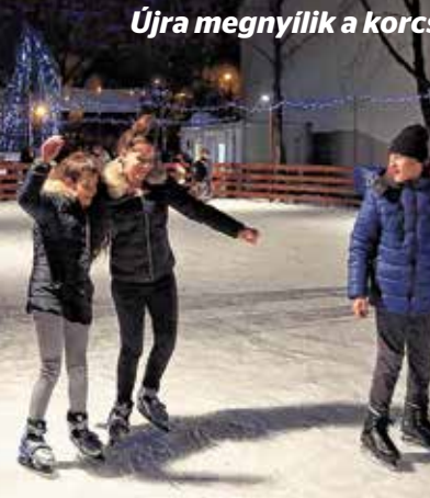
Újra megnyílik a korcsolyapálya

A látványos show-elemek, programok két további adventi vasárnapon is visszatérnek, de a műsor tovább színesedik. 9-én az Újhegyi Községi Házban a Benned van az X? tehetségkutató győztesei is bemutatkoznak, míg 16-án újra a Kőrösihez költözik a vidám forgatag, s a Tutta Forza ad karácsonyi koncertet.