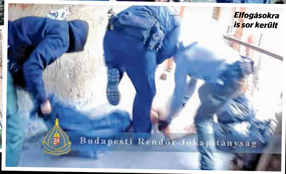
Elfogásokra is sor került