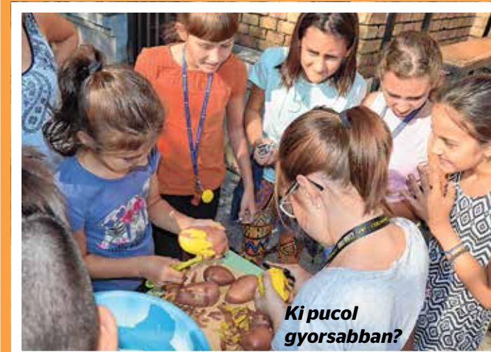
Kis pucol gyorsabban?