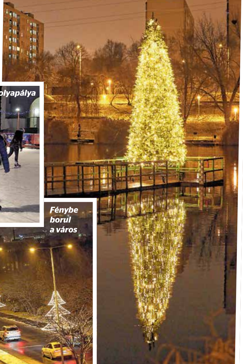
A Mély-tó karácsonyfája idén is pompázni fog