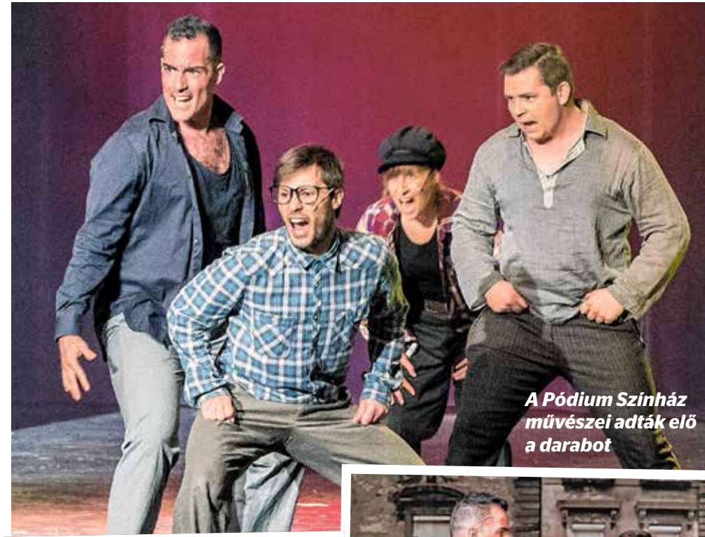
A Pódium Színház művészei adták elő a darabot