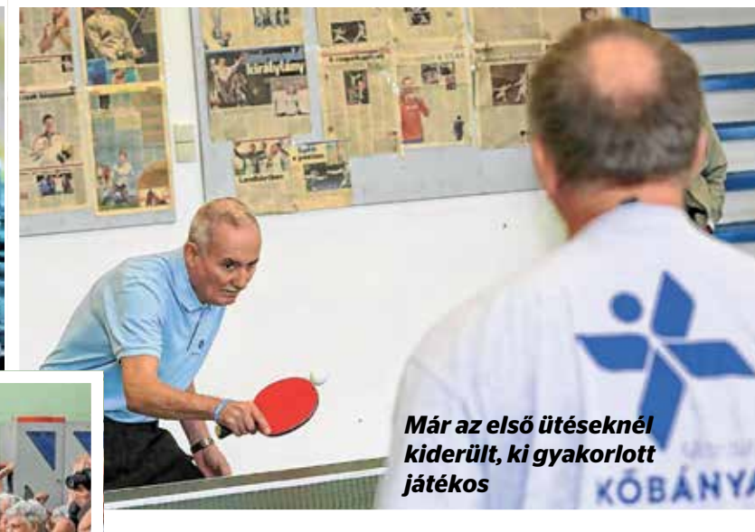
Már az első ütéseknél kiderült, ki gyakorlott játékos

tak. Legnagyobb örömet hozott az ebéd utáni eredményhirdetés is. Mivel a sportolók teljesítményét nemcsak női és férfi kategória, illetve az egyes számok alapján ítélték meg, hanem három korosztályban is, így mintegy nyolcvan kaptak kisebb-nagyobb ajándékokat az oklevelek, érmekek mellett.