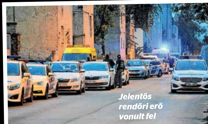
Jelentős rendőri erő vonult fel

Újabb lépést tett a Kőbányai Önkormányzat a Hős utcában mára tarthatatlanná vált helyzet felszámolására: kezdeményezésére a társasház portaszolgálatot, illetve regisztrációs kötelezettséget vezet be a ingatlanokban élő családok, gyermekek, idős emberek és vagyonuk védelmében. A jövőben csak azok léphetnek be az ingatlan területére, akik igazolható módon ott élnek, vagy lakói engedélyt kapnak rá. Ez hozzájárul ahhoz, hogy már a veszélyes állapotú házak lebontása előtt javuljon a környék közbiztonsága és köztisztasága.