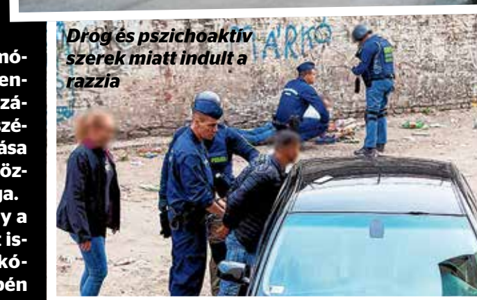
Drog és pszichoaktív szerek miatt indult a razzia

Az ügy előzménye, hogy a drogelosztó központként ismert Hős utca 15/A-B lakótömbökben október közepén a rendőrség összehangolt razzit indított. Összesen 29 személyt állítottak elő, közülük 14-et kábítószer-kereskedelem, valamint új pszichoaktív anyagok visszaélése miatt, hatot pedig kábítószerbirtoklás gyanújával hallgattak ki. Az egyenruhások több lakásban is kutattak gyanús, fehér port, növényi törmelék és több mint másfél millió forintot foglaltak le. A képviselő-testület két