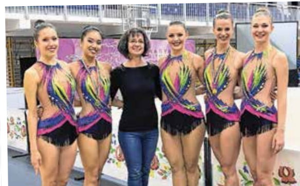
Beatrixék az országos bajnokságokon rendre hozzák a dobogós helyezéseket

A házaspár mindkét tagja ezer szállal kötődik Kőbányá-