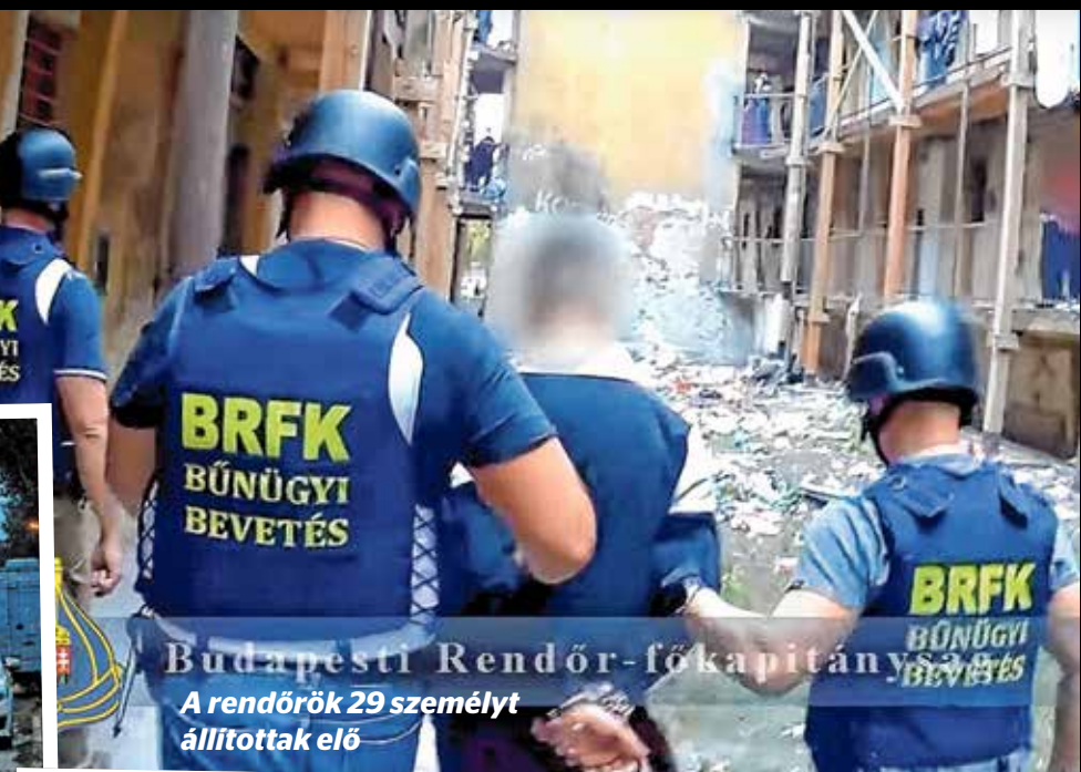
Budapesti Rendőr-főkapitány A rendőrök 29 személyt állítottak elő

ellenzéki politikus tartózkodott -, vagyis ellenszavazat nélkül született döntés. A Kőbányai Vagyonkezelő Zrt. közös képviselő által beterjesztett javaslatokat a 25-ei közgyűlésén a társasház elfogadta. Így a megvalósítást követően a regisztrációs kötelezettség nyomán csak az igazolhatóan ott élők léphetnek majd a társasház területére, illetve azok a személyek, akiknek erre valamelyik lakó engedélyt ad, de ők is csak a regisztráció után. Ez remélhetően ellehetesíti a drogforgalmazást, mivel távol tartja a vásárlókat. Fontos tudni, hogy a javaslatban szereplő 131 millió forint nem a tényleges költség. Magának a kerítés megépítésének ára kevesebb, mint