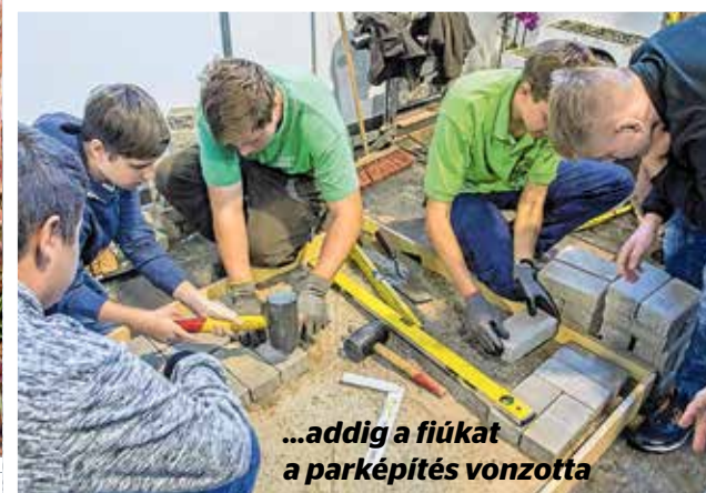
...addig a fiúkat a parképítés vonzotta