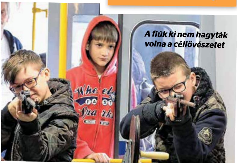
A fiúk ki nem hagyták volna a céllövészetet