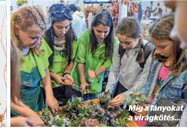
Míg a lányokat a virágkötés...