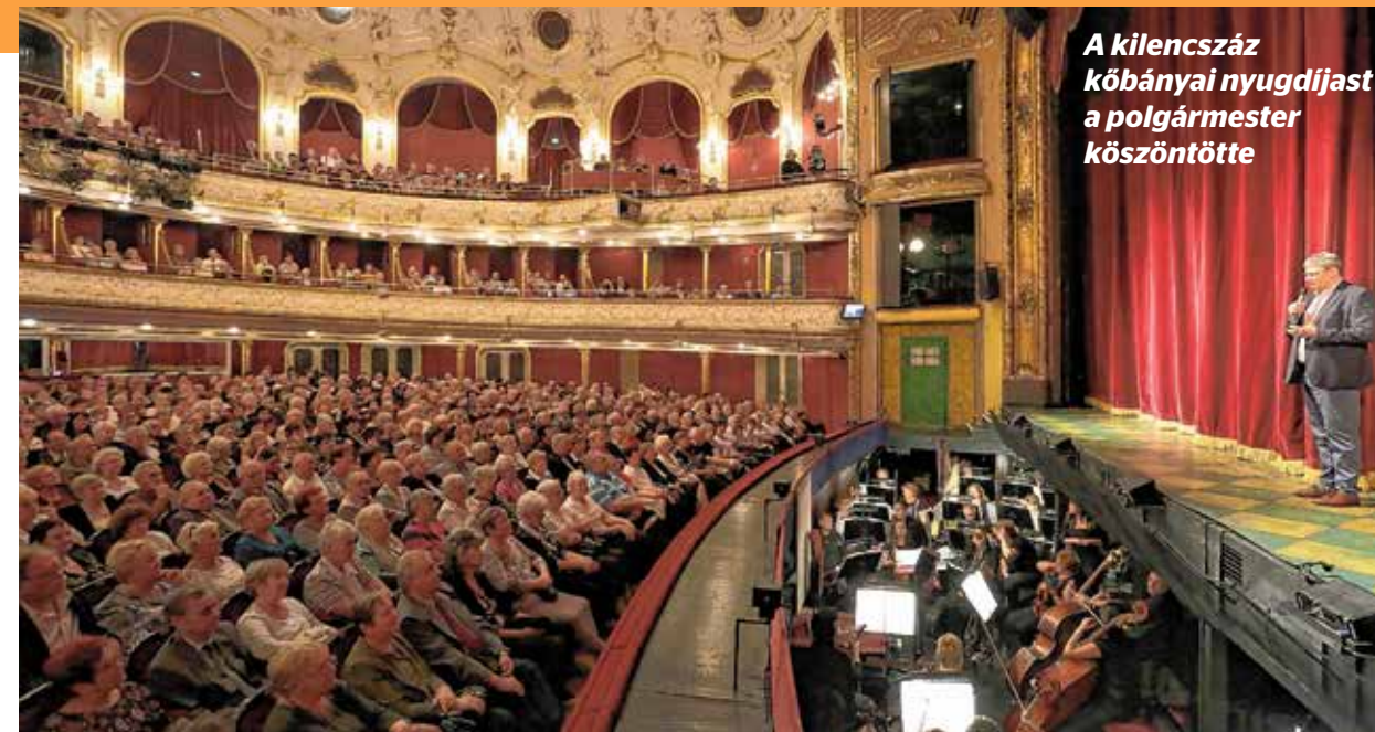
A kilencszáz kőbányai nyugdíjast a polgármester köszöntötte

A mintegy háromórás előadás után hazafelé tartó tömeg nemcsak a mostani és a tavalyi, de már a „jövő évi” előadást is izgatottan kibeszélte. Sokan ugyanis azt fejtették, hogy remélhetőleg jövőre is hasonló meglepetésben lesz részük az Idősek Világnapja alkalmából, s ezzel a mostani remek szereposztással talán a Csárdáskirálynőn vagy a Luxemburg grófnán derülhetnek nagyokat.