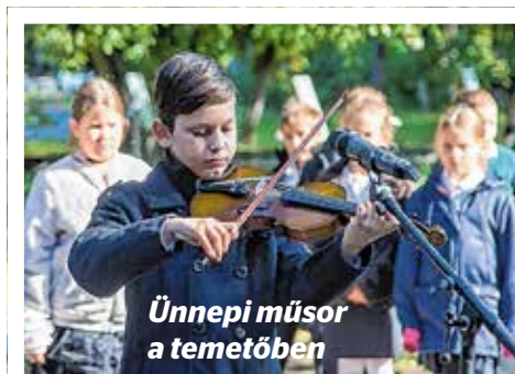
Ünnepi műsor a temetőben