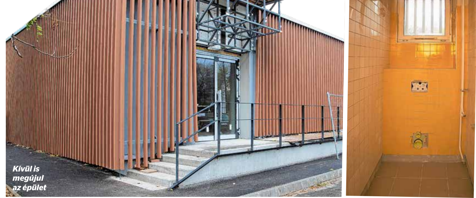
Kívül is megújul az épület

Salgótarjáni úti, a Zsvaj utcai és a Kerepesi úti intézetek újultak meg.