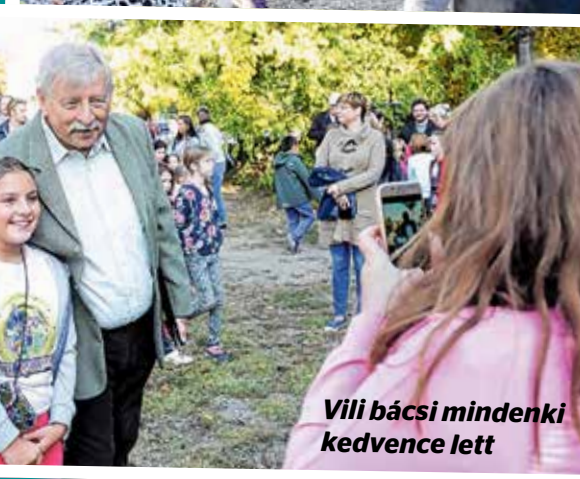
VIII. bácsí mindenki kedvence lett