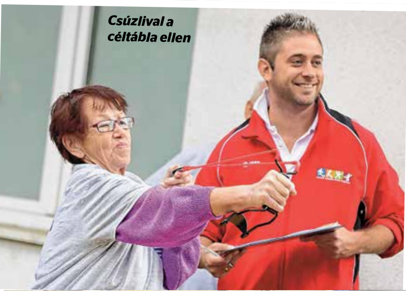
Csúzlival a céltábla ellen

tetődobás kosárlabdával, célba lövés csúzlival, darts, focigolf, gumicsizmadobás, minigerely-hajítás, nordic walking, pétanque számban indulhat-