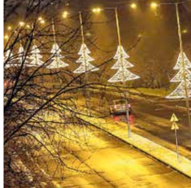
Fénybe borul a város