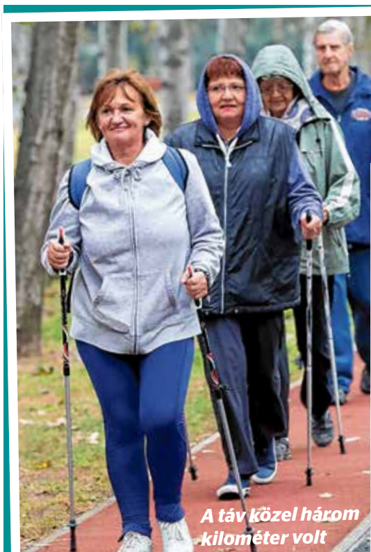
A táv közel három kilométer volt

A magyar csapat legeredményesebb versenyzője Milák Kristóf úszó lett, aki három aranyat és egy ezüzzel szerzett. A 79 fős küldöttség a negyedik helyen végzett az éremtáblázaton Oroszország, Kína és Japán mögött.