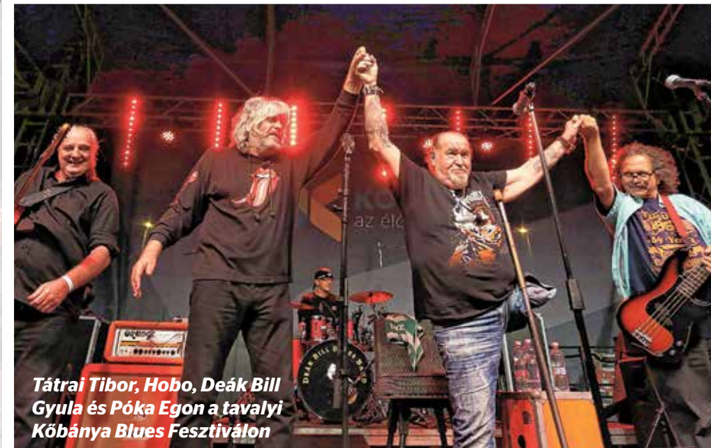
Tátrai Tibor, Hobo, Deák Bill Gyula és Póka Egon a tavalyi Kőbányai Blues Fesztiválon

– Tény, hogy cenzúra volt, de mi mentünk előre. A sikereinket jól mutatta, hogy amikor kezdetben még egyetlen lemezt sem adtunk ki, a Pajtás című újság slágerlistáján már öt dalunk is szerepelt.