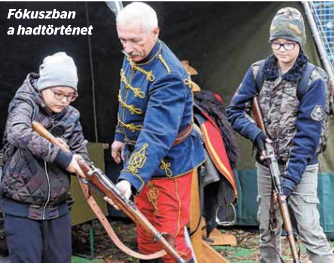
Fókuszban a hadtörténet