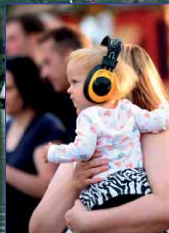
A képek a tavalyi rendezvényen készültek