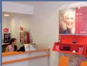
Jól felszerelt hallásközpontjainkban egyedülálló szolgáltatási háttérrel várjuk.

Ha a hallásvesztés legapróbb tüneteit is észleli magán, keresse fel legközelebbi hallásközpontunkat, hogy