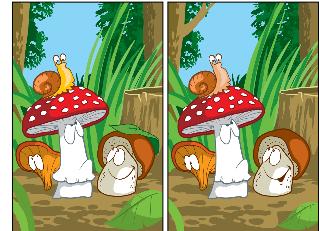
KÜLÖNBÉSÉG A két kép között 10 eltérés van. Izgalmasabb, ha méred, hogy mennyi idő alatt találsz meg a különbségeket