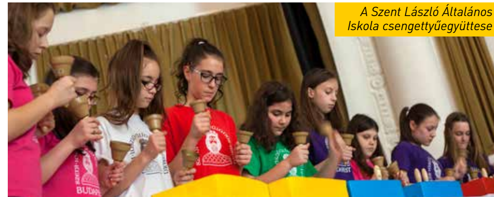
A Szent László Általános Iskola csengettyűgyűjtése

Kőbánya kötődik Szent László királyunkhoz, aki 940 éve lépett trónra és akit 825 éve avattak szentté. A Miniszterelnökség civilek kezdeményezésére emlékévvé nyilvánította 2017-et. Ehhez kapcsolódóan megmozdultak a kőbányai iskolák és sokan mások, hogy színes rendezvénysorozattal adózzanak szent királyunk emlékének.