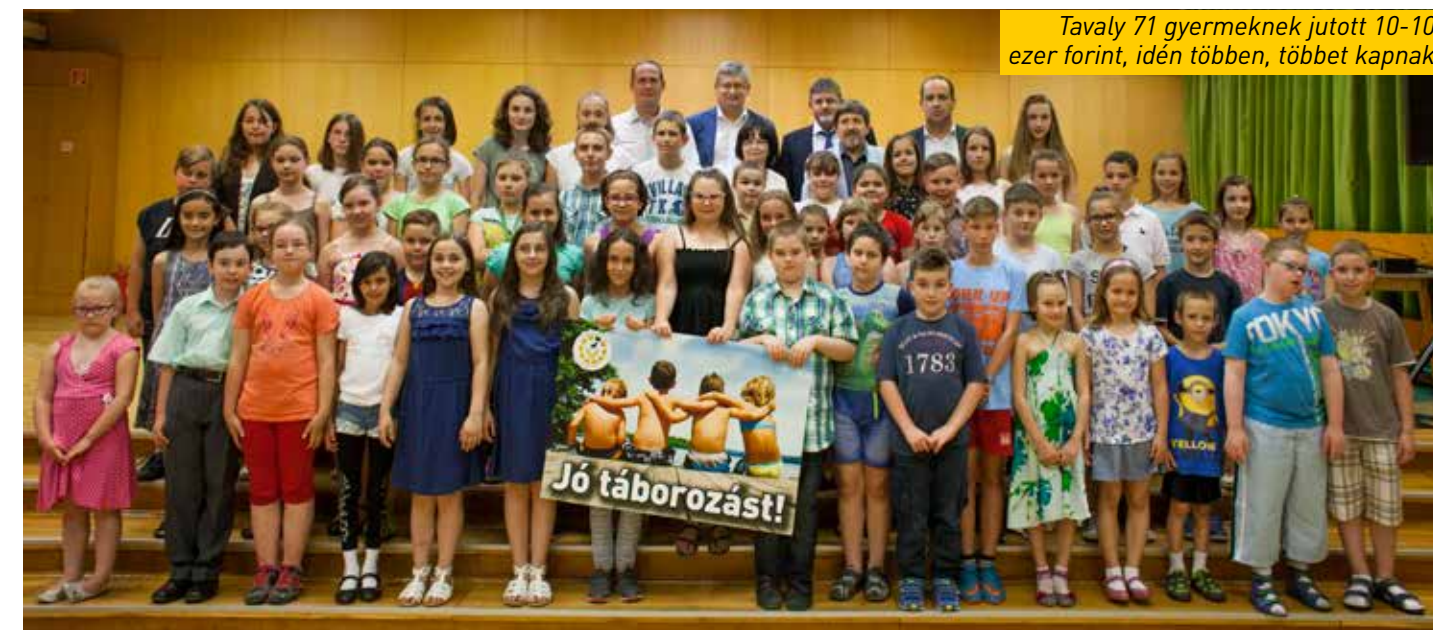
Tavaly 71 gyermeknek jutott 10-10 ezer forint, idén többen, többet kapnak

Száz kőbányai gyermek nyaralását támogatja másfél millió forinttal dr. György István, Budapest főváros kormány megbízottja a tavaly decemberi jótékonyági koncertjén összegyűlt adományoknak köszönhetően. A Kőbányai Szociális Védegyelet pályázatán gyermekenként 15 ezer forint nyerhető.