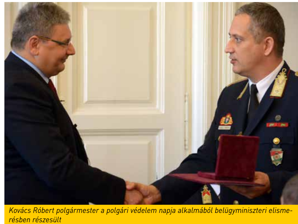
Kovács Róbert polgármester a polgári védelem napja alkalmából belügyminiszteri elismerésben részesült

Módosították a szociális ellátásokról szóló rendeletet, hogy azok a rászorulóknak (idősek, mozgáskorlátozottak), akiknek támogatásképpen az önkormányzat korábban valamilyen gyógyászati segédeszköz vásárolt és az eszköz időközben javít-