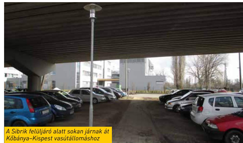
A Sibrik felüljáró alatt sokan járnak át Kőbánya-Kispest vasútállomáshoz

Bár a budapesti közvilágítás fejlesztése és működtetése kizárólag a Fővárosi Önkormányzathoz tartozó feladat, a közbiztonság javítása érdekében a kerületi önkormányzat évről évre több millió forinttal „száll be” a közvilágítás hiányosságainak pótlásába.