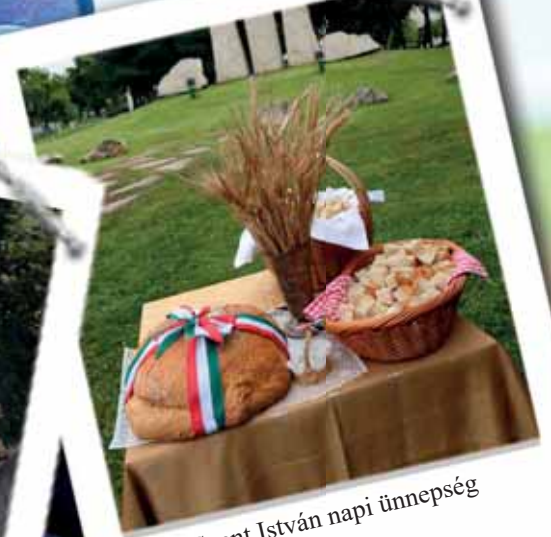
Szent István napi ünnepség (2. oldal)