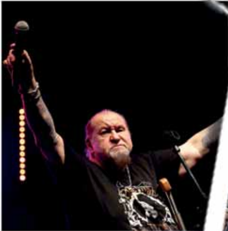
Kőbányai Blues Fesztivál (3. oldal)