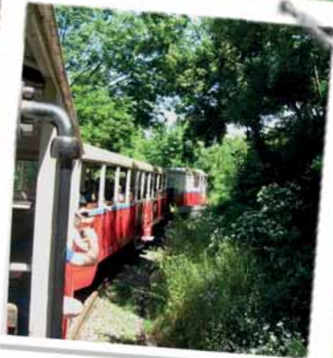
Ezüst korúak kirándulása (5. oldal)