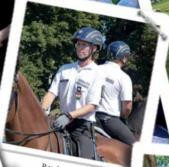
Rendvédelmi nap (3. oldal)