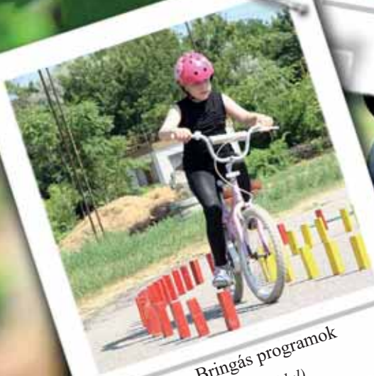
Bringás programok (4. oldal)