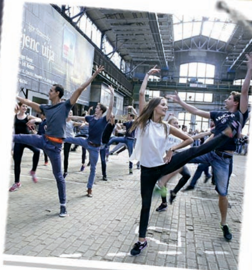
Opera Kőbányán (3. oldal)