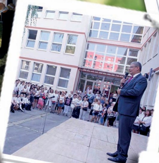
Elkezdődött a tanév (3. oldal)