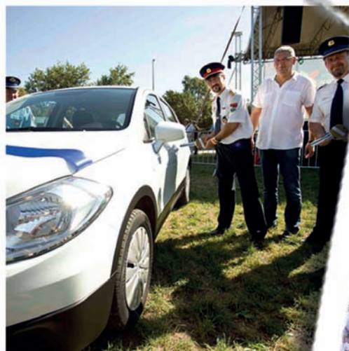
Új autó a rendőrségnek (2. oldal)