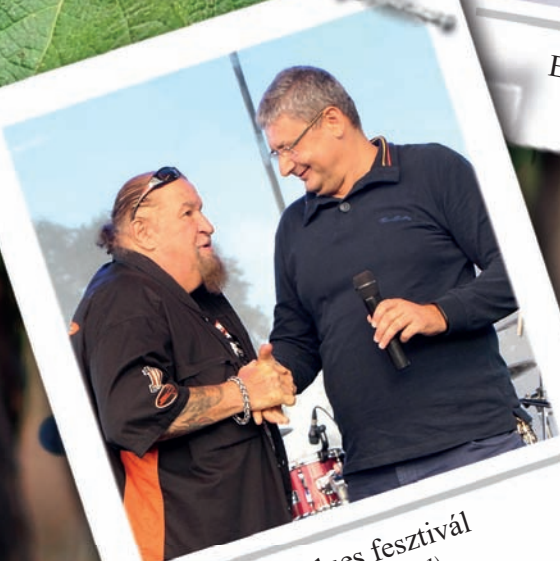
Blues fesztivál (2. oldal)