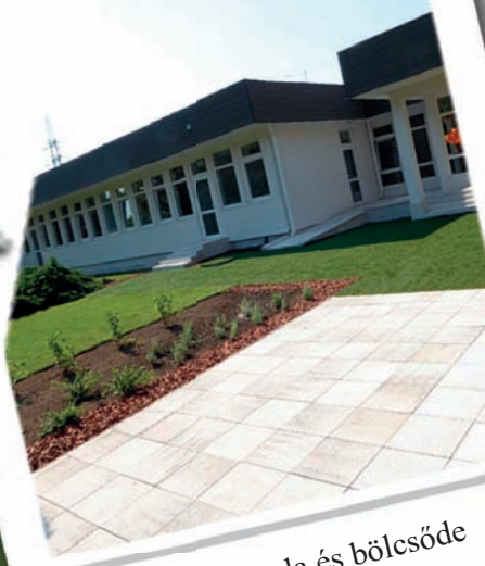
Új óvoda és bölcsőde (3. oldal)