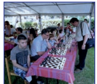
(a képek korábbi rendezvényről készültek)