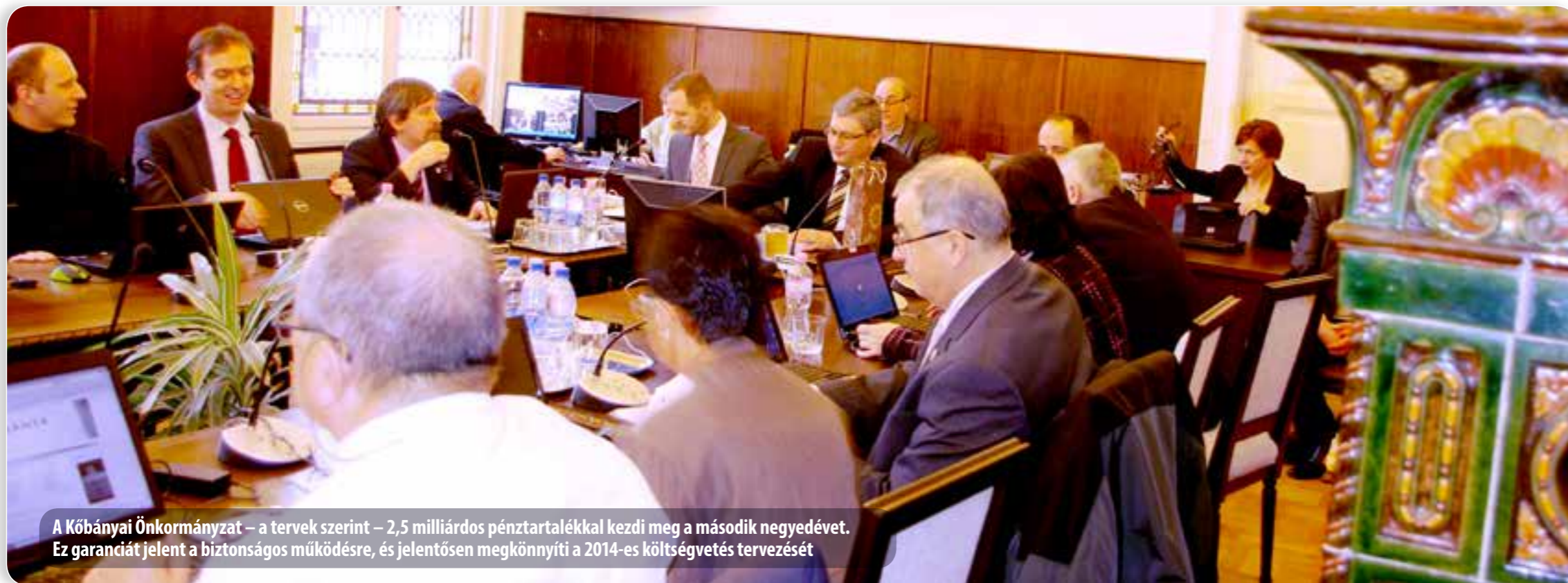
A Kőbányai Önkormányzat – a tervek szerint – 2,5 milliárdos pénztartalékkal kezdi meg a második negyedét. Ez garanciát jelent a biztonságos működésre, és jelentősen megkönnyíti a 2014-es költségvetés tervezését