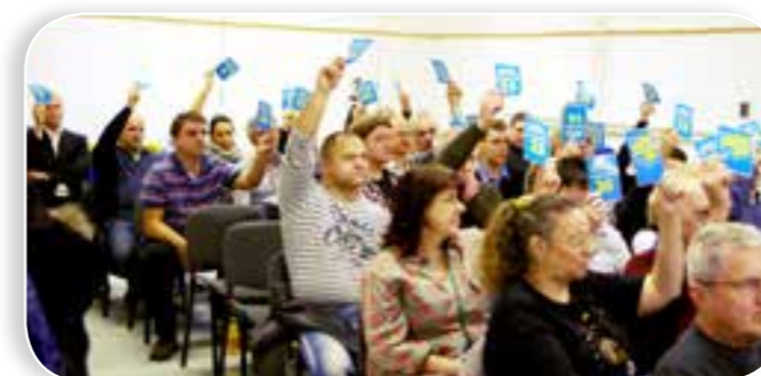
Minden szakosztály életét könnyíteni szeretné az új elnök. Ezt készítik most elő