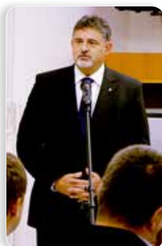
„A kormány sportkonceptiója jó háttér lesz az eredményes munkához”