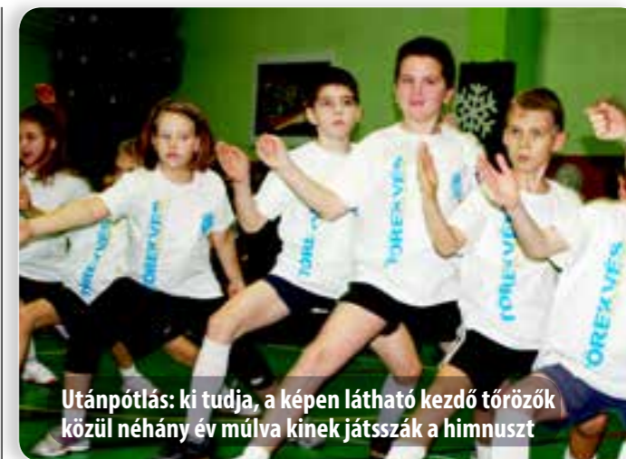
Utánpótlás: ki tudja, a képen látható kezdő törözők közül néhány év múlva kinek játszák a himnuszt