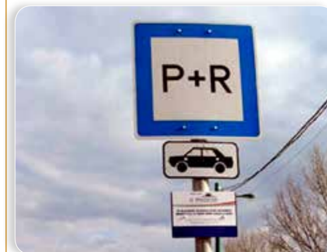
A P+R parkolóhelyek bővítése alapvető feltétele a közösségi közlekedés előnyben részesítésének

Mielőbb szeretnénk átadni a nap mint nap erre közlekedő kispesztiek, kőbányaiak, a XVIII. kerületben és a környező településeken élők számára a parkolót, hiszen a P+R parkolóhelyek bővítése egyik alapfeltétele a közösségi közlekedés előnyben részesítésének. A városban egyébként sajnos sok helyütt bonyolult tulajdonosi viszony és ebből adódó jogvita hátráltatja a P+R parkolók kialakítását, nem a szándék és a munka hiánya miatt nincs előrelépés. De további jó hír Kőbányán, hogy – a hosszas tulajdonosi viták és jogi helyzet rendbetétele után – idén végre sor kerülhet a P+R kialakítására az Örs vezér téren, és még idén P+R nyílik a Pillangó utcánál is.