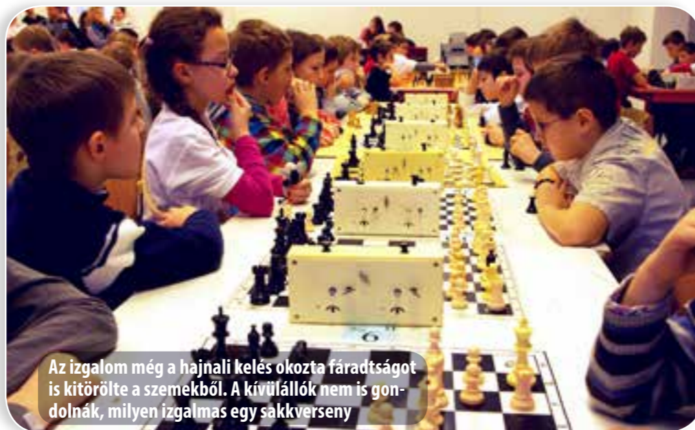
Az izgalom még a hajnali kelés okozta fáradtságot is kitörölte a szemekből. A kívülállók nem is gondolnák, milyen izgalmas egy sakkművelés