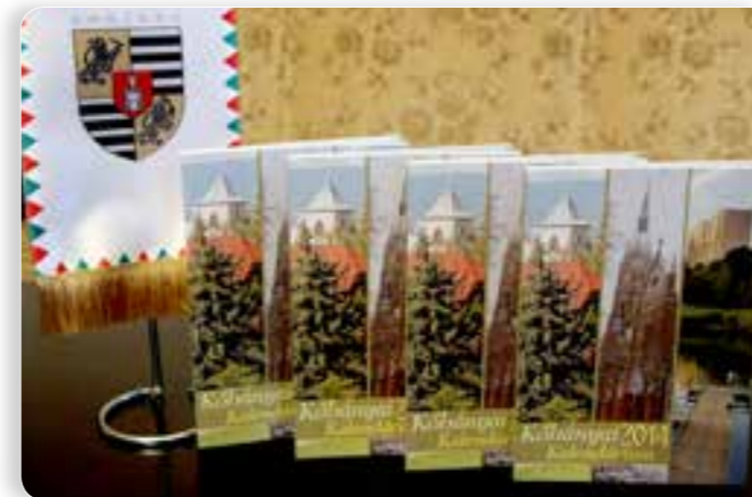
Helyi szerzők is helyet kaptak a könyvben. Sőt, a Kalendáriumhoz kapcsolódva programok, tanfolyamok, vetélkedők szervezését is tervezik