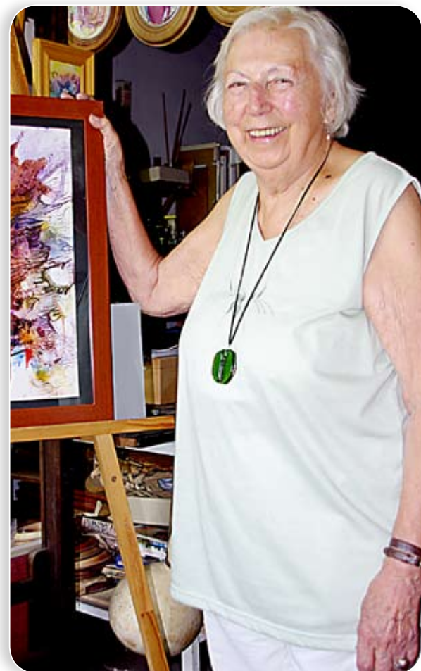
„Mindig alkotni szerettem volna, létrehozni, kitalálni valamit”

Igen, merem mondani, hogy az egész életet így élem, mert számomra minden forma egy játék. Azt tapasztalom, hogy a játékot sokan nem veszik elég komolyan. Pedig ha megnézzük, ebben van az élet, a halál, a gyönyör, a szenvedés, a gondolat, az érzés. Örömet lelem a formákban, játszom velük, új formákat alkotok, és értékelem a szépségüket, de nincs szükségem arra, hogy mechanikusan ragaszkozzak egy-egy irányzathoz. Az öröm és a bánat például mások által lép be az életünkbe, a játék viszont ál-