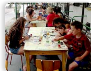
Lengyel és szlovák gyerekek üdültek a Balatonnál

A vendégek a X. kerület testvérvárosai közül: a szlovákiai Párkány (Štúrovo) és a lengyel Jarosław városból utaztak Balatonlelléig, hogy eltöltsenek egy kellemes hetet. Az időjárásnak köszönhetően nemcsak a Balaton vizét élvezhették, hanem a sétahajózást is. Emellett az izgalmas napirendről: a vendégek megtekintették az éppen Balatonlellén turnézó Magyar Nemzeti Cirkusz lélegzetelállító előadását, illetve ellátogattak Balatonboglár frissen megnyílt kalandparkjába. Ezekon kívül kirándulást tettek a Szántódpusztai Kulturális és Hagyományörző Napok 2013 programra, ahol a Magyarok vására és lovas programok várták őket. A röpké egy hét alatt testvérvárosaink idelátogató lakói, hála a remek időjárásnak és remek programszervezőiknek, nemcsak bepillantást nyertek Kőbánya és Balatonlelle életébe és számtalan sokszínű programba, de remélhetőleg felejthetetlenül jól is érezték magukat!