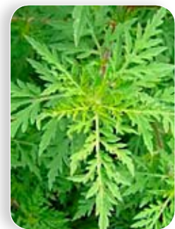
Indul a parlagfűszezon

a hozzátartozó járda, zóldsáv gyommentesítéséről és tisztán tartásáról. Július 1-jétől pedig hatósági eljárás indul az ellen, aki elmulasztja portáján a parlagfű-mentesítést. Augusztus közepe táján exponenciálisan megemelkedik a