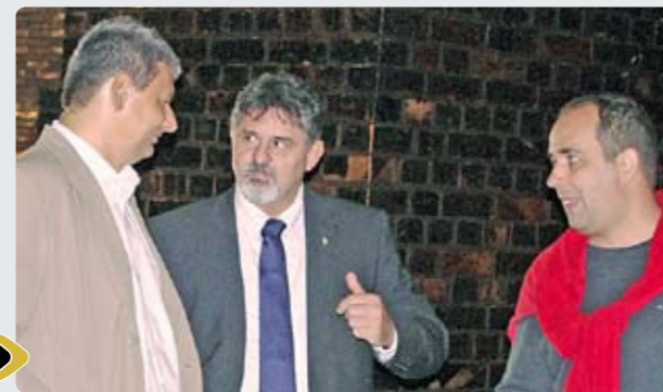
Eszmecsere a föld alatt

„Nagyon örülök, hogy most is bebizonyosodott: van igény a kultúrára. Ahogy hallottam, rengeteg helyről jöttek megnézni a víztározót meg a többi kőbányai nevezetességet. És nagyon sok kőbányai iskolással, családdal, ismerőssel találkoztam a kis túránk során” – mondta Kovács Róbert, akivel az 1870-ben épült Ihász utcai víztározóban találkoztunk. A kerület polgármestere a 11 ezer köbméteres medencében futott össze dr. György István főpolgármester-helyettessel és Radványi Gábor alpolgármesterrel is.