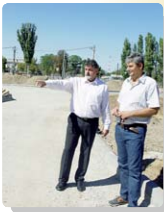
A főváros és Kőbánya együttműködésében épül a körforgalom