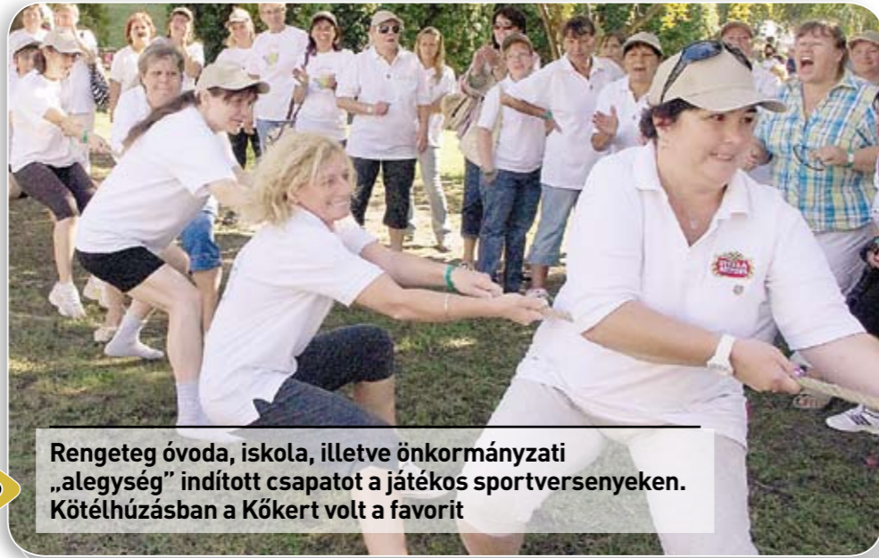
Rengeteg óvoda, iskola, illetve önkormányzati „alegység” indított csapatot a játékos sportversenyeken. Kötélhúzásban a Kőkert volt a favorit