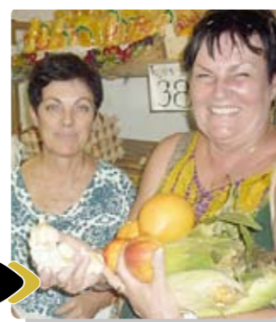
Jó árú és jó hangulat! Jó ide bejönni! – így véli ezt e cikk szerzője is

Egy karcagi biogazda gondolatai: „Minden magyar ember megérdemelne, hogy ilyen piacon vásárolhasson! Isten áldását kérem erre a nemes kezdeményezésre.”