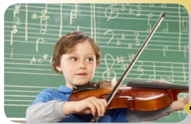
Fiatal tehetségeket támogatnak

szolgáltatásokat, tárgyi eszközök térítésmentes biztosítását vagy bármit, amiről úgy gondolják, a tehetségek gondozásának szolgálatába állítható. Az alapítvány várja együttműködő partnereit, akikkel közösen vállalhat szerepet a tehetségbarát társadalom formálásában.