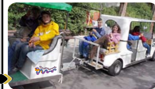
Varázskaravánnal az állatkertben

hétvége, hanem azért is, mert a kőbányai Komplex Általános Iskola fogyatékkal élő gyermekeinek tudunk maradandó élményt szerezni az állatkerti látogatással; az elektromos autókban álló Varázskaravánról negyven csillogó szempár mosolygott végig az úton. Köszönet illet mindenkit, aki önzetlenül mellénk állt: