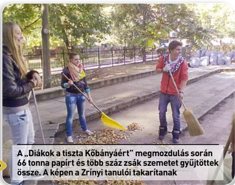
A „Diákok a tiszta Kőbányáért” megmozdulás során 66 tonna papírt és több száz zsák szemetet gyűjtöttek össze. A képen a Zrínyi tanulói takarítanak