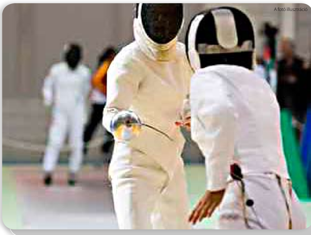
A fotó illusztráció