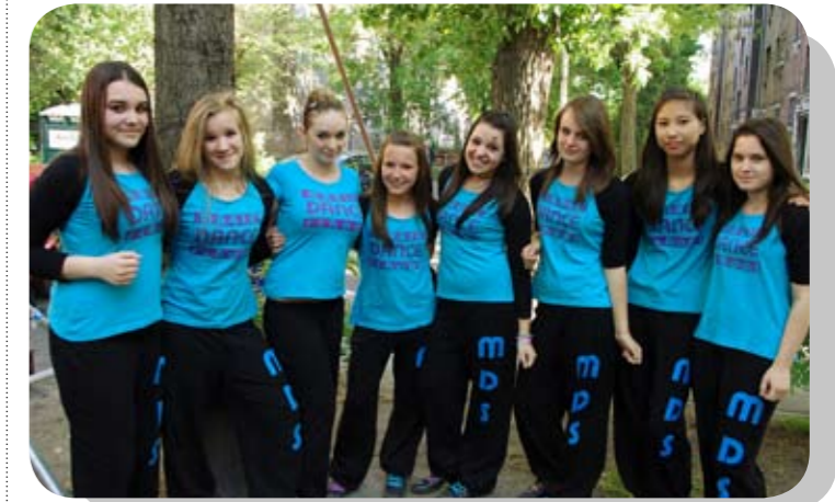
A lányok a Kis-Pongrác ünnepi mulatságán készülnek a fellépésre

A Kőbányai Fialatok Egyesület Magic Dance táncscsoportja a tanév, illetve a versenyszezon utolsó hetében három versenyen vettek részt, és mindhárom megmérettetésen remekül helytálltak a gyerekek.